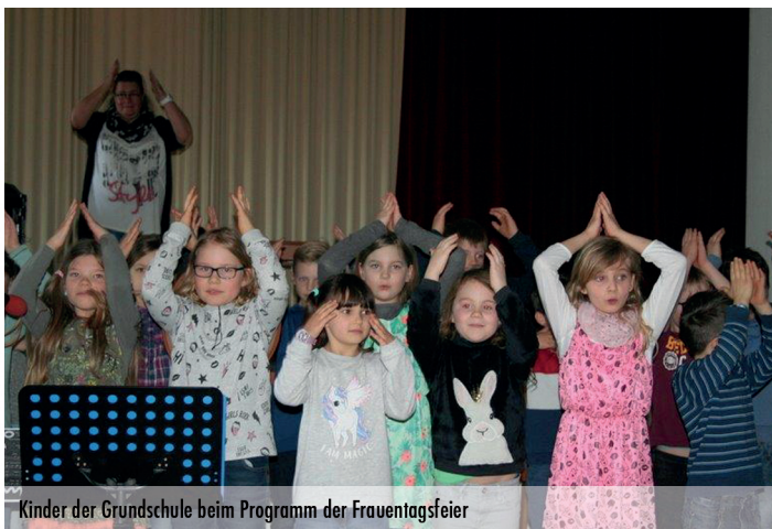
Kinder der Grundschule beim Programm der Frauentagsfeier