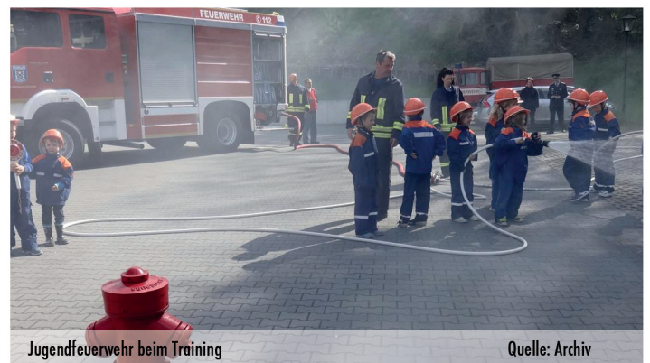
Jugendfeuerwehr beim Training

Erwähnen muss ich auch unsere interne Ausbildung. Bei unseren monatlichen Schulungsabenden nahmen im Durchschnitt 20