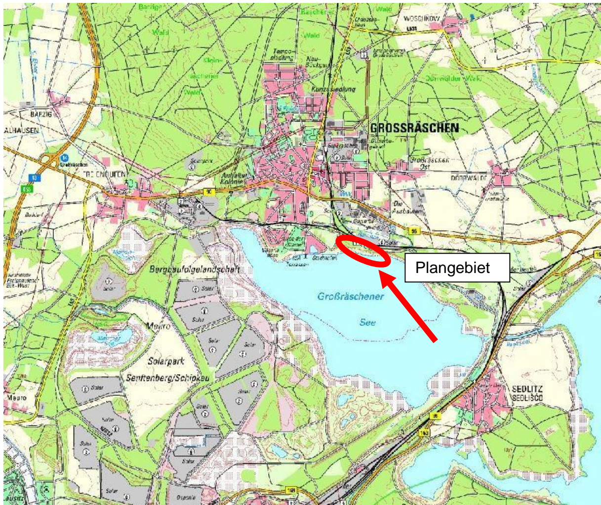
Abb. 1 – Übersichtskarte (Landkreis Oberspreewald Lausitz, Geobasisdaten: GeoBasis-DE/LGB, 2018)

Der Bebauungsplan Nr. 19 „Stadtstrand Großräschen“ soll bauplanungsrechtlich die Voraussetzung für die Errichtung eines öffentlichen Badestrandes mit Parkplatz und Funktionsgebäude am nordöstlichen Ufer des Großräschener Sees schaffen. Der Bebauungsplan wird als qualifizierter Bebauungsplan aufgestellt.