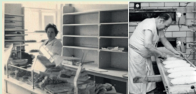
Bäckerei Berendt

Gern würden wir diese thematischen Sammlungen mit Ihren Erinnerungen erweitern. Falls Sie darüber hinaus noch Fotos mit ehemaligen Buckowern haben, – wir scannen diese in den PC ein und geben sie Ihnen sofort zurück!