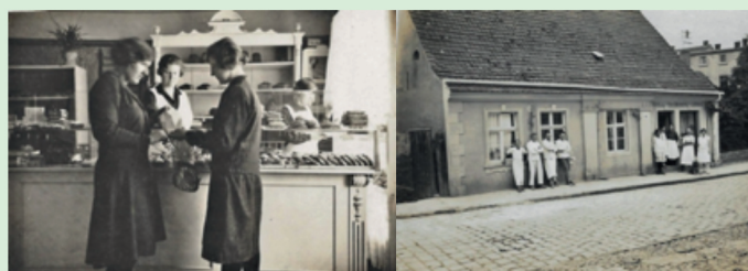
Hier ein Auszug der Sammlung „Bäckermeister“: Bäckerei Wendt