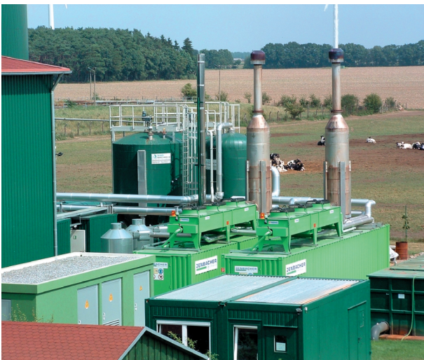
Abb. 10.1: Die Biogasanlage Karstädt ging im Dezember 2001 in Betrieb und vergärt ca. 50.000 m 3 Rindergülle und ca. 20.000 t/a verschiedener biogener Abfälle, wie Fettabscheiderinhalte, Schlacht- und Pizzaabfälle. Die Anlage ist als Abfallbehandlungsanlage nach BImSchG genehmigt.

Aus diesem Grund wurde im Geschäftsbereich des MLUV eine Koordinierungsstelle „Biogas“ eingerichtet. Von dieser werden die anstehenden bzw. an sie herangetragenen Probleme bewertet und gebündelt, Anfragen an den/die zuständige(n) Mitarbeiter(in) weitergeleitet, die Lösung auftretender Widersprüche und Hindernisse mit den tangierten Fachgebieten organisiert und möglichst verbindliche Aussagen an Dritte gegeben.