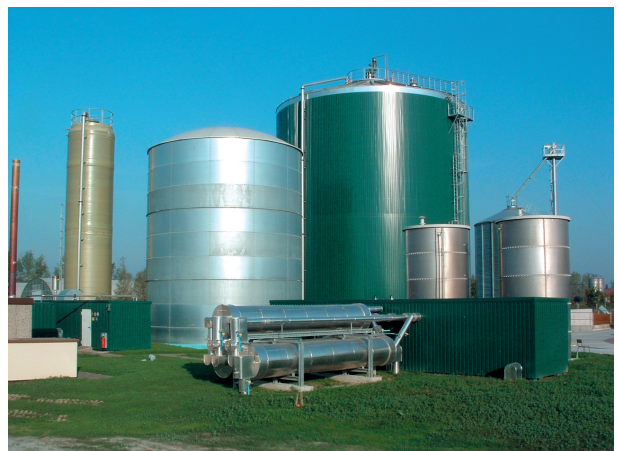
Abb. 10.3: Die im September 2006 in Betrieb gegangene und nach BImSchG genehmigte NawaRo-Biogasanlage in Görlsdorf hat eine Leistung von 850 kW el . Es werden Rindergülle, Maissilage und Getreidekörner vergoren.