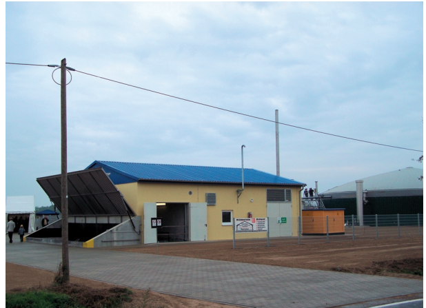
Abb. 10.2: In Niedergörsdorf in Teltow-Fläming werden in einer 500 kW el -Anlage Schweinegülle und NawaRos vergoren. Links im Bild der Substrat-Zufuhrschacht.

Landesumweltamt Brandenburg Abt. Technischer Umweltschutz, Ref. T1 Koordinierungsstelle Biogas Berliner Str. 21 - 25 14467 Potsdam Tel.: (0331) 2776 40