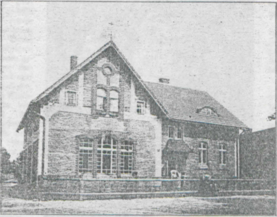
Das Gemeindehaus der Frauenhülfe in Werben (Spreewald).