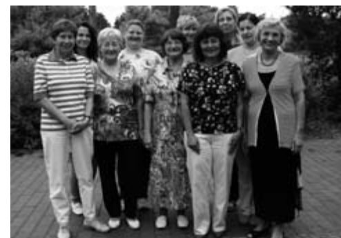
Ein Teil der guten Geister