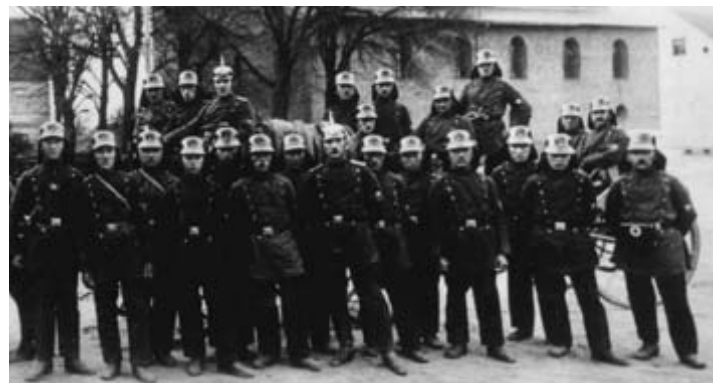
Die Freiwillige Feuerwehr Saarmund 1926 bei der Abnahme mit ihrer Ausrüstung.