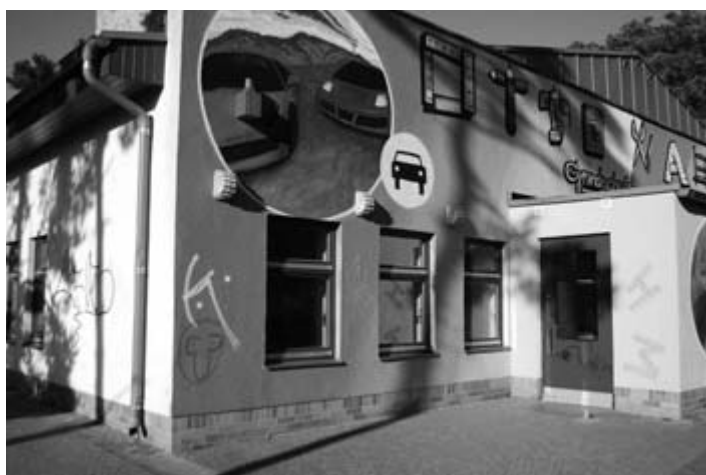
Selbst die 2007 von den 6. Klassen gestaltete Eingangsfront der Aula wird schon nicht mehr respektiert.