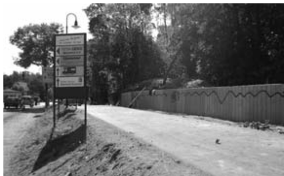
Zum Verständnis hier ein Bild der Palisadenwand zu Bauzeiten an der Bushaltestelle Verdistr.