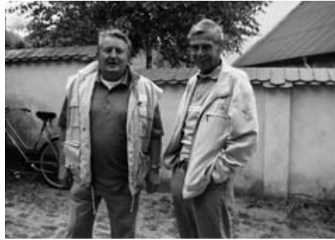
... und Klassenkameraden