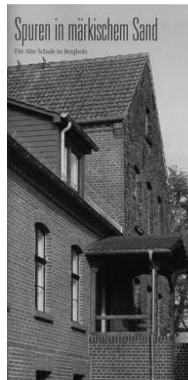
Zum Ehemaligentreffen (siehe Kolumne und Seite 24/25) erschien die Broschüre „Die Alte Schule in Bergholz“ in der Reihe „Spuren im märkischen Sand“. Herausgeber ist der Förderverein Begegnungshaus der Generationen Nutheetal e.V.