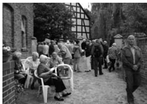
Gedränge vor der Alten Schule