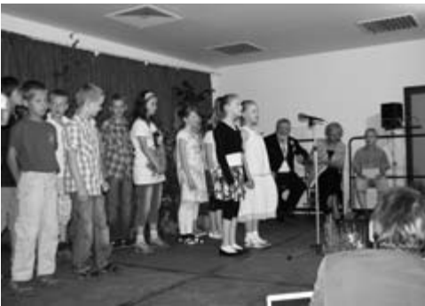
Lieder für die Gäste