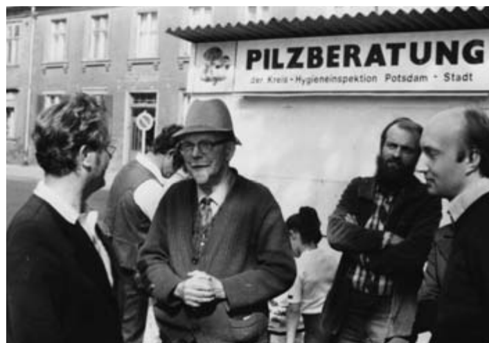
Pilzberatung auf dem Potsdamer Wochenmarkt, ohne Jahresangabe.