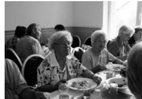
Nudeln mit Gulasch