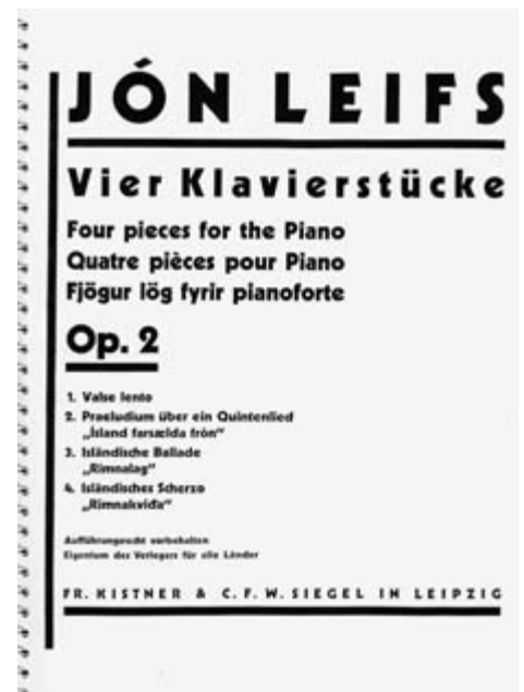
Jón Leifs verarbeitete das isländische Liedgut in seinen Kompositionen, wie hier in diesen Klavierstücken.