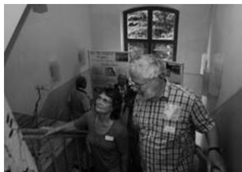
Bewunderung für die neue alte Schule