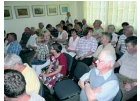
Der neugestaltete Gemeinderaum