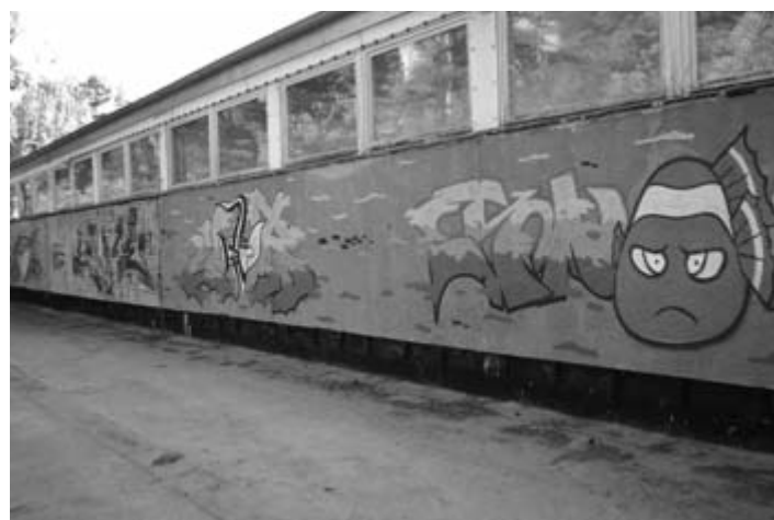
Die erste genehmigte Nuthetalers Graffiti-Fläche wird schon angenommen.