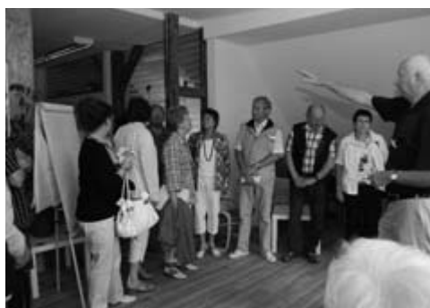
Der Bereich des Jugendclubs