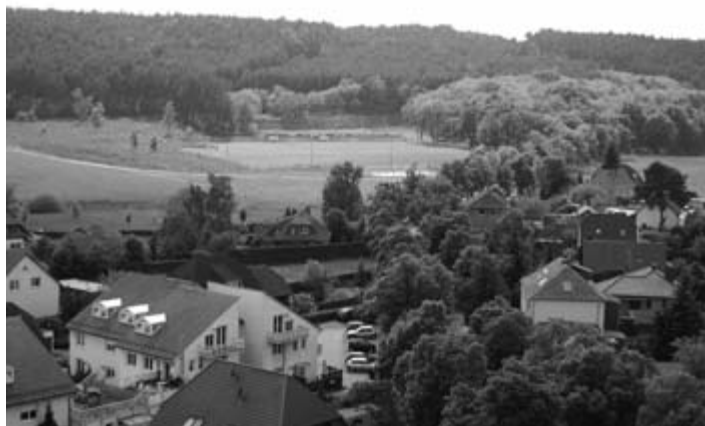
Blick auf den Saarmunder Eichberg. Davor liegt der Sportplatz der SG Saarmund. Weiter rechts könnte sich die geplante Sommerrodelbahn in den Wald einfügen.