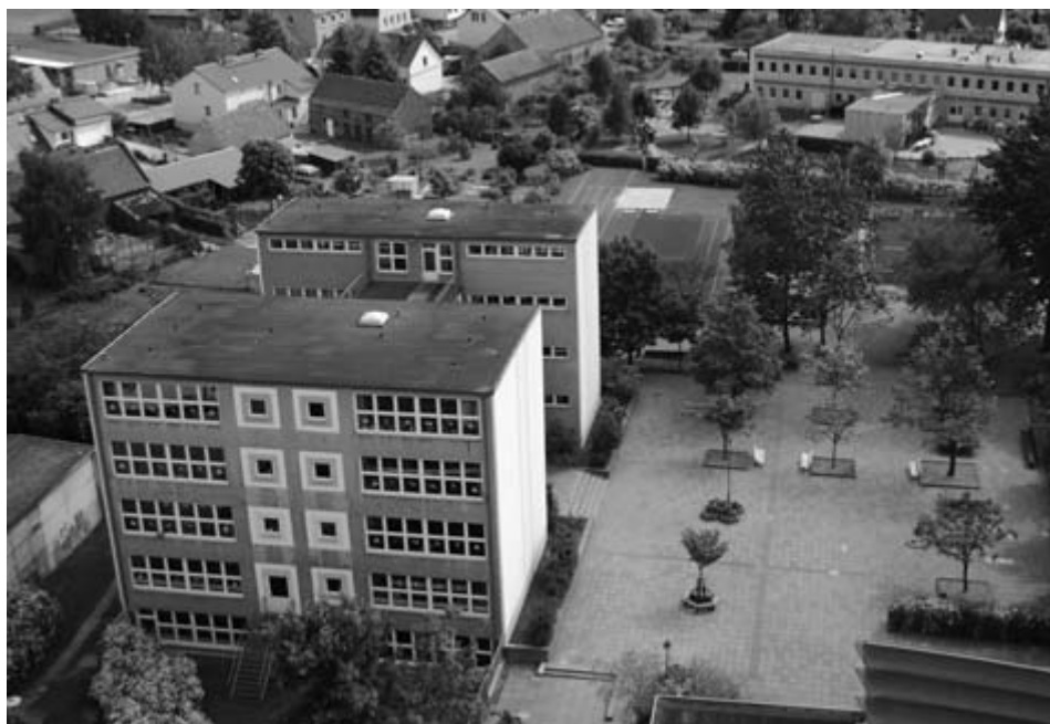
Die Schule samt Schulhof, Fußballfeld und Kleinsportanlage sowie die Kita Freche Früchtchen im Juni 2010 aus der Vogelperspektive. Für das Fußballfeld gibt es wegen der großen Nachfrage sogar für die Pausen einen Belegungsplan. Haben die Großen Unterricht, spielen die Kita-Kinder drauf. Die Kleinsportanlage wird in den Unterricht einbezogen. Der Kindergarten nutzt die Fläche für körperliche Ertüchtigung.