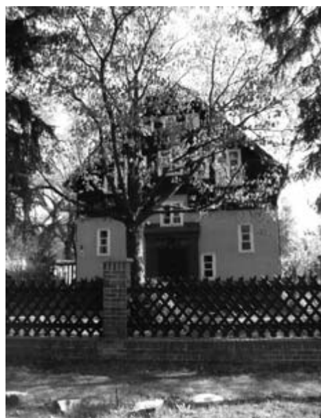
Am Wiesengrund 2