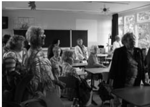
Besichtigung der neuen Grundschule