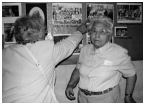
Das bin ich!