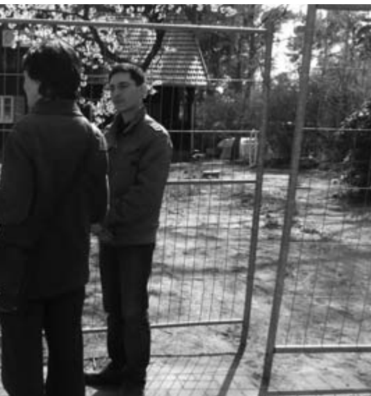
em Haus Liselotte-Herrmann-Str. 9