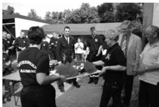
Die Festschokolade wird unter Beifall herausgetragen.

löschfahrzeug von der Feuerwehr Bergholz-Rehbrücke von der Wasserversorgung unabhängiger. Das Gerätehaus wird umfassend für die erwarteten Neufahrzeuge 2008 renoviert und saniert – vieles in Eigenleistung. 2009 beschafft die Gemeinde Nuthetal für die Saarmunder Wehr für über 400.000 Euro ein Löschgruppenfahrzeug und einen Rüstwagen IVECO-Magirus . Damit verfügen die Saarmunder Kameraden 20 Jahre nach der Wende über Hightech im Dienste der Brand- und Gefahrenabwehr.