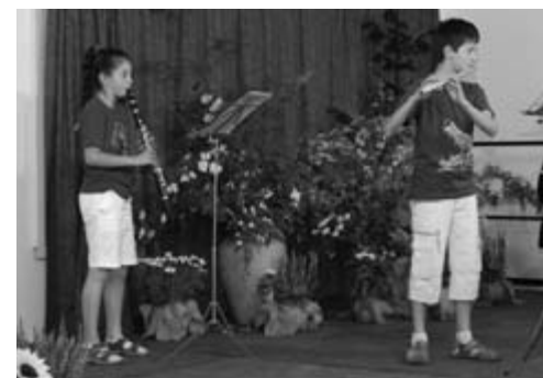
Volkslieder für Klarinette und Querflöte