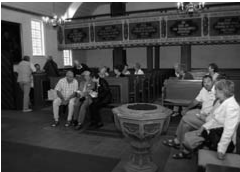
Auch die Kirche wurde besichtigt