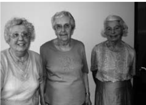
Die ältesten Schülerinnen