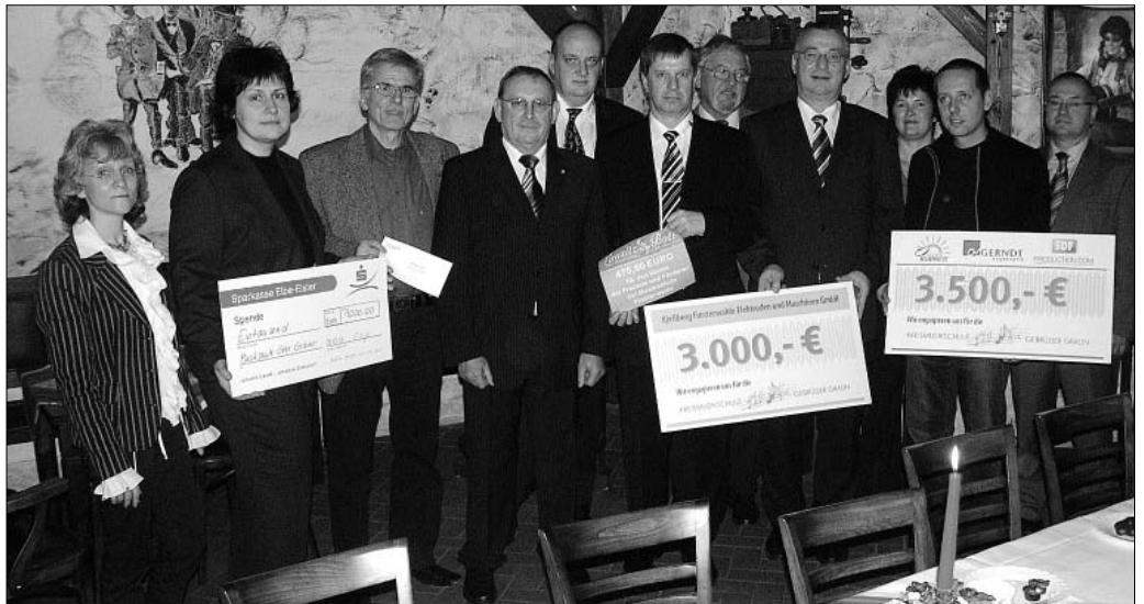
Die Sponsoren waren sich einig. „Wir wollen die großartigen Leistungen der Musikschüler anerkennen und werden auch weiterhin die Musikschule unterstützen.“