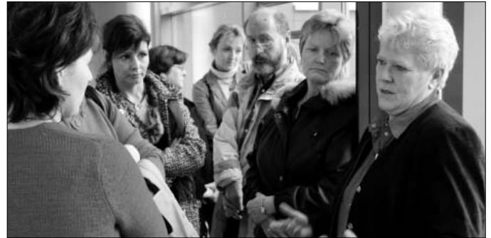
Die Fotos zu Szenen häuslicher Gewalt regten zur Diskussion an.

nungsrede: „Noch immer ist häusliche Gewalt ein gesellschaftliches Tabuthema. Wir alle sollten dafür eintreten, dass das Schweigen gebrochen wird und dieses als gesellschaftliches Phänomen begriffen wird, das alle angeht.“ Mit der Ausstellung sollen möglichst viele Bürger für das Thema sensibilisiert werden. Zur Eröffnung erschienen neben Bürgern und Vertretern der Kreisverwaltung auch Vertreter von Opfererschutzverbänden im Landkreis Elbe-Elster. Bereits am 11. Dezember 2006 wurden die Exponate den Abgeordneten des Kreistages im Landkreis