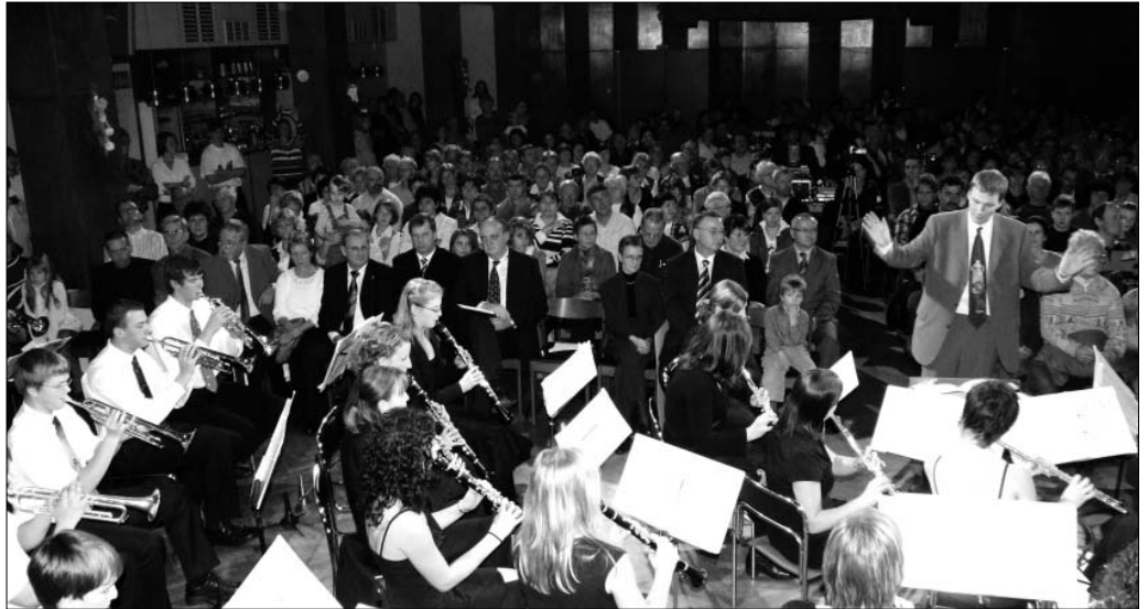
Sehr viel Beifall gab es für musikalische Darbietungen, die das Publikum im ausverkauften Saal der Gaststätte „Alt-Nauendorf“ zum Klatschen und Mitsingen anregten