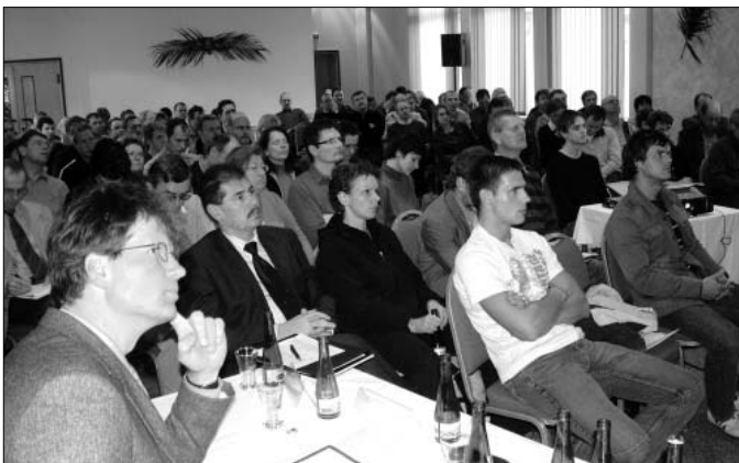
Besonders die Verbindung zwischen Praktikern und Wissenschaftlern machte die Bodenschutztagung zum Erfolg.

Geeignete Lösungen sind bekannt und werden mit Erfolg auch in unserem Landkreis bereits angewandt: Bodenschonende Bewirtschaftungsverfahren, Auswahl und Folge geeigneter Fruchtarten, Ökolandbau, Zwischenfruchtanbau zur Vermeidung von Erosion und begrünte Flächenstilllegung. Die Landwirte sind da schon auf einem guten Weg. Keinesfalls soll dadurch der Landwirt aber zum Energiewirt gemacht werden. Nur eine gesicherte Landwirtschaft kann zusätzliche Energieproduktion ermöglichen - nicht umgekehrt. So kann auch gewährleistet werden, dass die Erzeugung von Bioenergie nicht zu Monokulturen führt. (hf)