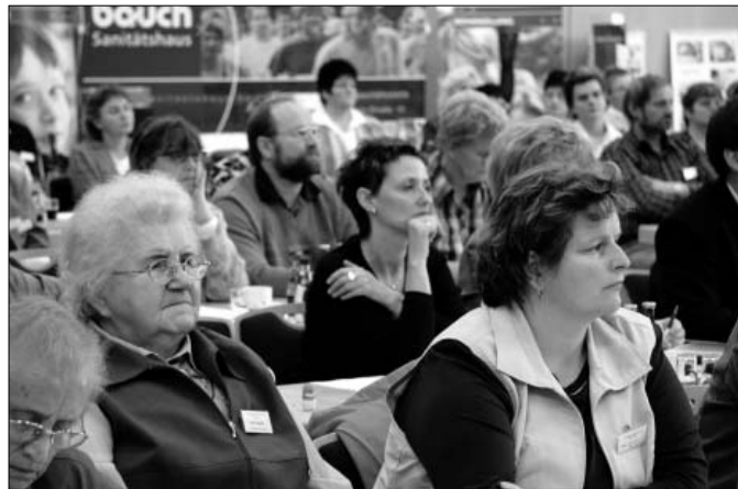
Über 160 Teilnehmer jeden Alters kamen nach Falkenberg.