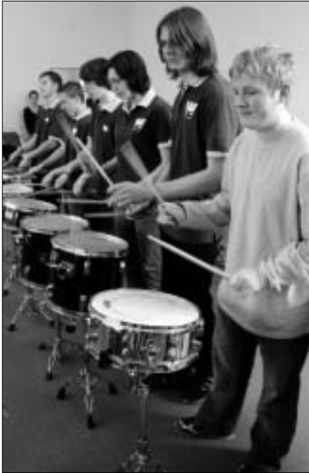
Die Schlagzeuggruppe "Die Weberknechte" weiht den neuen Proberaum in der Kreismusikschule in Finsterwalde rhythmisch ein.

Mit einer Mischung aus rhythmischen Klängen und Showeinlagen weihte das Schlagzeugensemble am 24. Oktober 2006 den neuen Anbau der Kreismusikschule "Gebrüder Graun" in der Regionalstelle Finsterwalde ein.