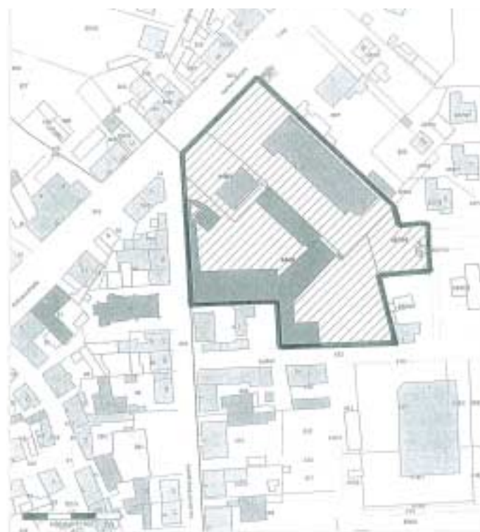
Geltungsbereich BP 03/11 „Gutshof Rathausstraße“ Gemarkung Ketzin/Havel, Flur 1, Flurstücke 448/1, 448/2, 449 und 457/16

Montag 08.00 - 12.00 Uhr und 12.30 - 15.30 Uhr Dienstag 08.00 - 12.00 Uhr und 12.30 - 16.00 Uhr Mittwoch 08.00 - 12.00 Uhr und 12.30 - 15.30 Uhr Donnerstag 08.00 - 12.00 Uhr und 13.00 - 18.00 Uhr Freitag 08.00 - 12.00 Uhr.