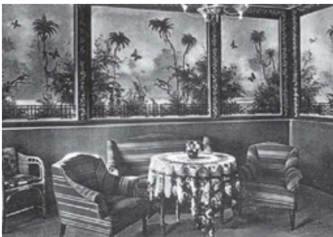
Die Wandmalereien des Gastraumes im Gotischen Haus Paretz sind heute nicht mehr vorhanden.

In seinen wirtschaftlich schwierigen Zeiten schuf er neben den Ehrenbürgerurkunden für die Stadt Ketzin ebenfalls solche für Werder/Havel und malte außer den Gasträumen im „Gotischen Haus“ in Paretz auch diese im „Haus Gloth“ – heute Hotel zur Insel – in seiner Geburtsstadt Werder/Havel aus. Die farbenfrohen Ausmalungen im Haus Gloth konnten sich wahrscheinlich bis zur Übernahme des Hauses durch die HO im Jahre 1958 halten. Im „Gotischen Haus“ in Paretz wurden die Wandbemalungen des Schankraumes und des Königszimmer, die von Willi Eplinius im Stil der Tapeten aus dem Schloss Paretz ausgeführt wurden, bereits 1939 durch den für die Erhaltung des histori-