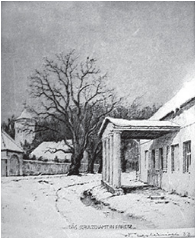
Radierung – Das Schulzenamt in Paretz –