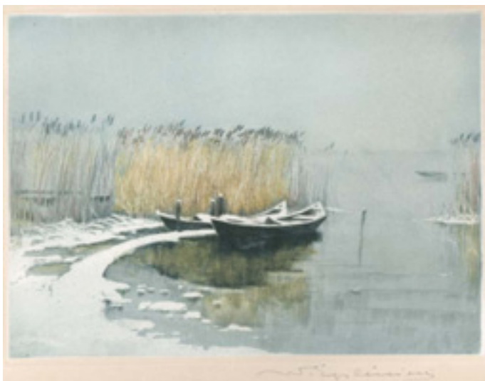
Colorierte Radierung „Vorfrühling“ ca. 1925; Vertrieb ehemals u.a. über „Kunsthandlung Fritz Merkel“, Berlin