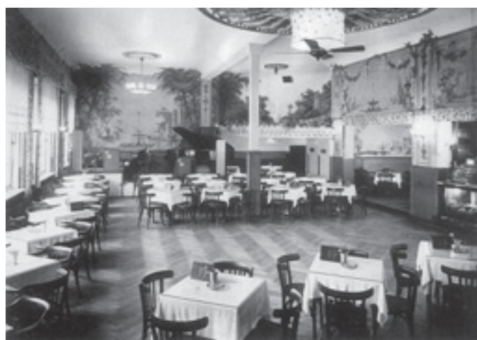
Eplinius farbenfrohe Ausmalungen von 1934 im Gastraum des „Hauses Gloth“ – heute Hotel zur Insel in Werder/Havel.