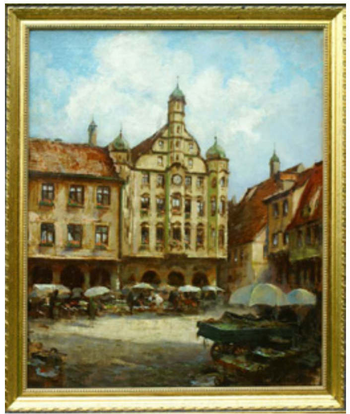
Öl auf Leinwand. „Marktplatz von Memmingen“ (Allgäu) zeugt von Eplinius Besuchen in südlichen Regionen.