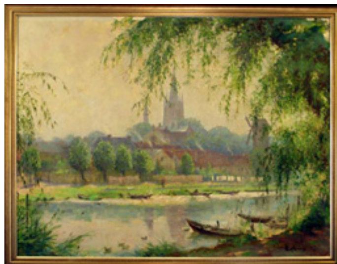
„Blick auf die Inselstadt Werder“ im Stadtverordneten-Sitzungssaal vom „Alten Rathaus“ in Werder/Havel von 1942