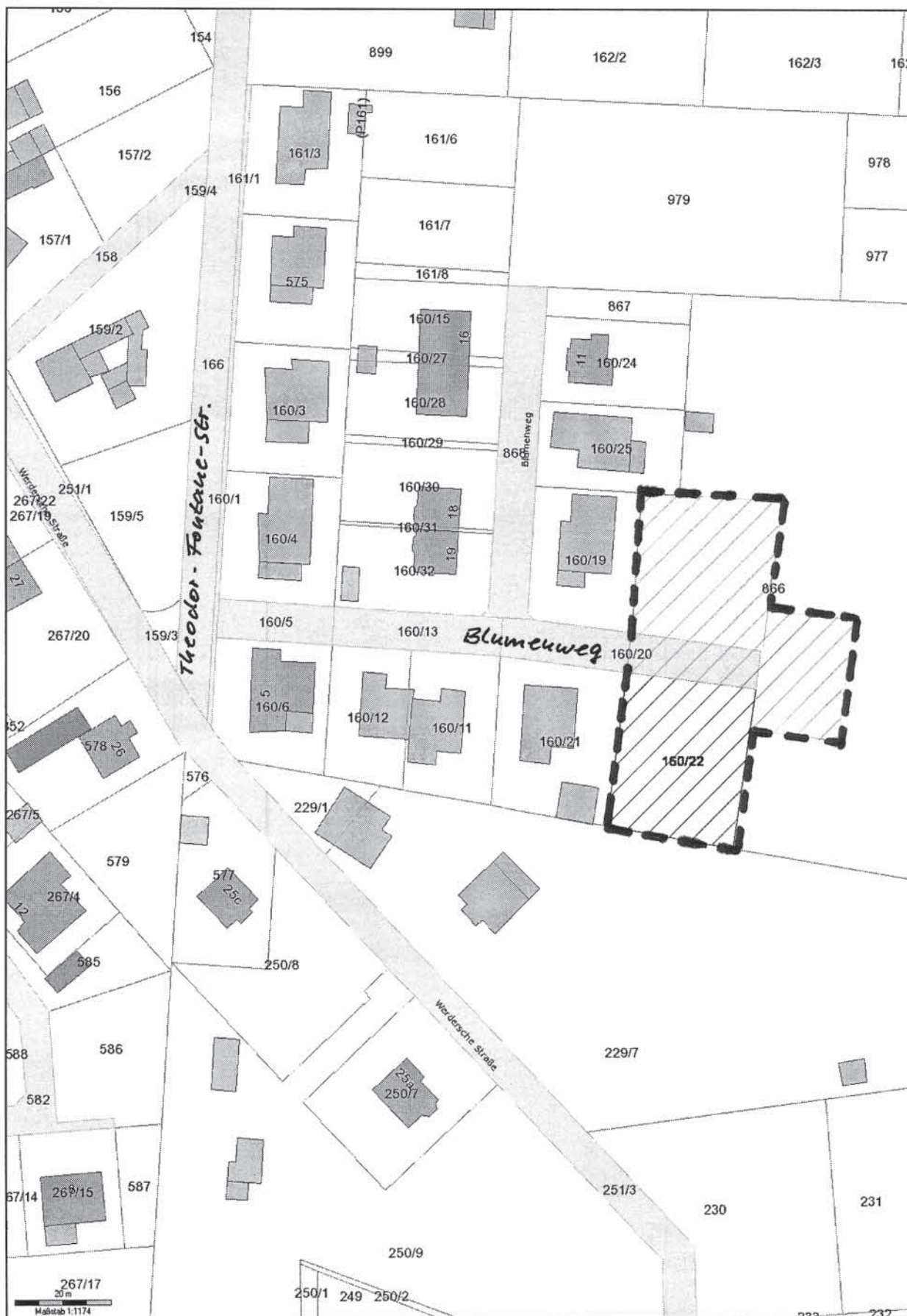
Geltungsbereich B-Plan 01/06 'Blumenweg'