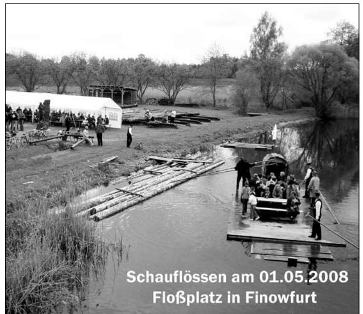
Schauflößen am 01.05.2008 Floßplatz in Finowfurt