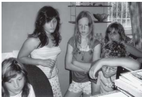
Kleine Pausen beim Zelten wurden mit Hochspannung am PC verbracht