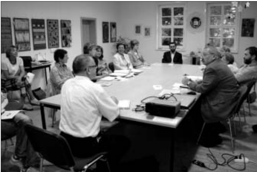
Die freiwilligen Helfer wollen gemeinsam zum 50-jährigen Bestehen der Kreismusikschule im Landkreis Elbe-Elster ein Treffen Ehemaliger organisieren.

tung eines Treffens von Ehemaligen am 7. Juli 2007 in Bad Liebenwerda. Die freiwilligen Helfer suchen nun möglichst viele Mitstreiter, Lehrkräfte und Schüler, die mit Bildern, Programmheften und Geschichten aus dem Musikschulalltag zum Jubiläum beitragen können und an einem Treffen mit ehemaligen Mitschülern und Lehrern interessiert sind. Ansprechpartner sind an den Kreismusikschulen zu finden oder telefonisch unter 0 35 35/46 52 00 bzw. per E-Mail an musikschule.hz@lkee.de zu erreichen.