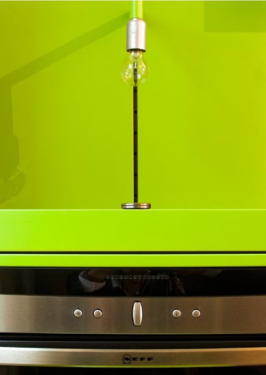
Einbaugeräte aus der aktuellen Produktpalette von Constructa-Neff lassen sich hervorragend auch in ausgefallene und experimentelle Küchenkonzepte integrieren und machen dort eine gute Figur.

Das Team 2 schuf eine u-förmige, aus zwei Seitenwänden und dem Boden gebildete Wanne, die als Doppelboden- und Vorwand-system in die bestehenden Räume eingebracht wird. Mit dieser Wanne lassen sich mehrere Probleme zugleich lösen: Erstens können so Kabel, Wasser- und Gasleitungen frei verlegt werden. Zweitens können die Position von Herd, Waschbecken und Spülmaschine frei gewählt werden. Drittens können so auch für die Wand widerstandsfähige Materialien eingesetzt werden, die den althergebrachten »Fliesenspiegel« vermeiden. Und viertens sind Möbelemente durch die vertikalen Fugen zwischen den Paneelen höhenstellbar und verschiebbar befestigbar. So entsteht ein hochlebendes und frisches Cluster aus Cuben verschiedenster Größen und Proportionen, manche offen, manche geschlossen ausgeführt, über einem collageartigen Materialmix aus Laminaten, Lackoberflächen und Holzoberflächen, womit die Grenze zwischen Wänden und Boden verschwimmt. »Panta rei« (alles fließt), die Küche gerät in Bewegung. Benötigen die Bewohner beispielsweise Platz für eine Party, so schieben sie nicht benötigte Möbelemente an die Decke, wo diese bis zur nächsten Benutzung parken können. Ziehen ältere Bewohner in diese Wohnung ein, so könne sich diese die Arbeitshöhen völlig frei neu auf ihre persönlichen Bedürfnisse einstellen.