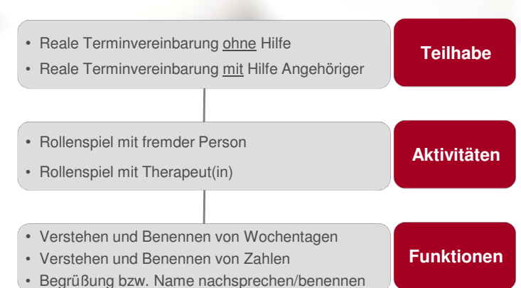
Abb. 3 Therapeutische Umsetzung des Ziels „Frau F. kann einen Termin beim Zahnarzt vereinbaren“