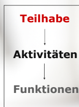
Abb. 1 Top-down Zielsetzung

Die Formulierung von Therapiezielen verläuft top-down. Im Vordergrund steht die Erfassung der Lebensbereiche, an denen die Betroffenen in Gesellschaft und Umwelt wieder teilhaben möchten, wie z.B. Vereinsaktivitäten. Dann sind Aktivitäten zu identifizieren, die für diese Teilhabe benötigt werden, wie z.B. das Führen eines Telefonats. Schließlich werden Funktionen festgelegt, wie z.B. Wortfindung oder Satzverständnis, die für die Aktivitätsausführung zu üben sind.