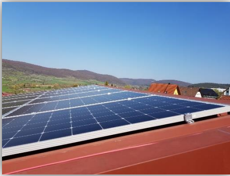
Abbildung 1, Teil der PV-Anlage der Firma Sintertechnik GmbH in Pretzfeld