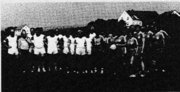
Gruppenbild (mit Damen): Die Emanzipation steht und stand an der Fachhochschule Nürnberg nie 'im abseits'.