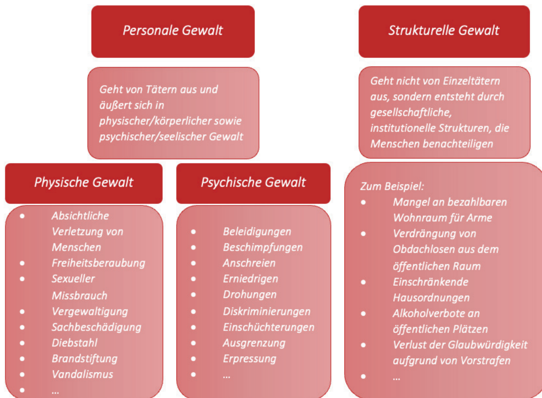
Abbildung 1: Typologien der Gewalt (eigene Darstellung nach Gillich/Keicher 2017, S.239)

Nachdem die Begrifflichkeiten und Formen nun geklärt wurden, soll im nächsten Punkt auf die Gewalt, die sich konkret gegen obdachlose Menschen richtet, näher eingegangen werden.