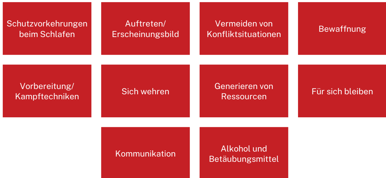
Abbildung 3 Bewältigungsmechanismen von obdachlosen Menschen bei Gewalterfahrungen (eigene Darstellung)

Insgesamt konnten zehn verschiedene Bewältigungsmechanismen ausgewertet werden. Unter den Begriff fallen sämtliche Verhaltensweisen, die dazu führen, besser vor Gewalt geschützt zu sein, beziehungsweise dieser vorzubeugen. Um ihr Überleben zu sichern, passen sich die Menschen an ihre Lebenswelt an und entwickeln Strategien um den bekannten Risiken vorrausschauend begegnen zu können. Folgende Abbildung zeigt die unterschiedlichen Herangehensweisen der Interviewpartner*innen: