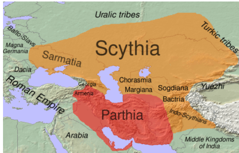
Abb.2: Landkarte zeigt die Verbreitung der ostiranischstämmigen skythischen Sprachgruppe (orange), das Partherreich (rot) und im Westen das Römische Reich. Hervorgehoben ist die Dreiländerecke bei Georgien und Armenien.