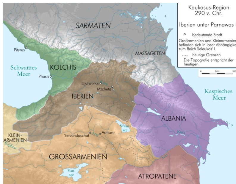
Abb. 1: Iberien unter dem ersten König Parnavas I. (290 v. Chr.). Kolchis wurde im 10. Jh. mit Iberien zum georgischen Königreich vereinigt. Albanien wurde nach den arabischen Eroberungen im 7. Jh. islamisiert und es entwickelte sich das heutige Aserbaidschan.

eines geeinten Königreiches zur Folge hatte. Die Aristokraten verbündeten sich nicht selten mit dem Feind des Königs, um die eigenen Machtansprüche zu sichern oder auszubauen. 133 Die Vereinigung aller georgischen Teilstaaten zu einem Königreich war im ersten Jahrtausend nicht zu erreichen. Dennoch wurde ein nicht unbedeutender Schritt in diese Richtung durch die Annahme des Christentums im 4. Jh. n. Chr. gemacht. Am Ende des 3. Jh.s kam es zu einer Dominanz des Römischen Reiches über das Sassanidenreich der Perser und so zu einer römischen Periode im Südkaukasus. 134 Diese politische Lage zu Gunsten des Römischen Reiches bildet den unmittelbaren Hintergrund zur Christianisierung der Armenier (301) und der georgischen Iberer (327).