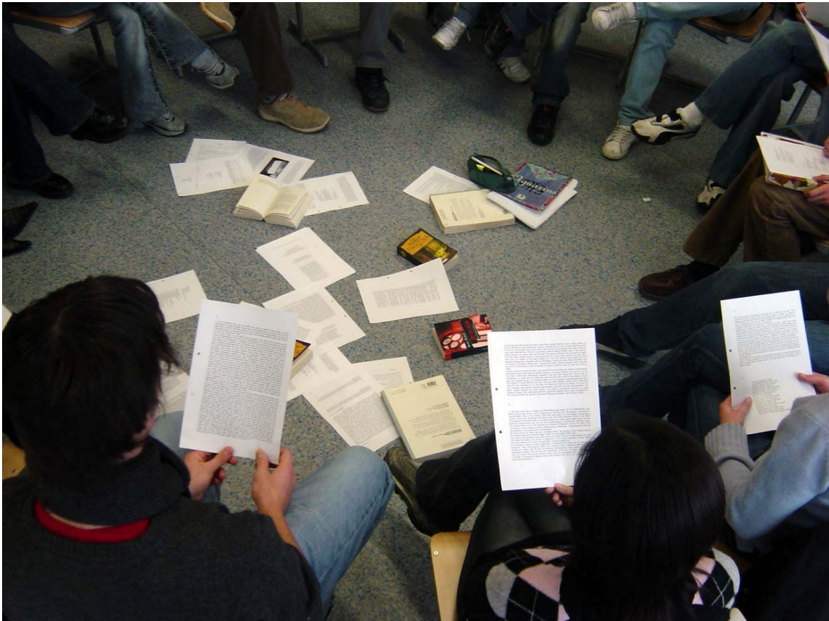
Abbildung 5.3: Arbeit mit dem Dossier Bücher/Lesen .