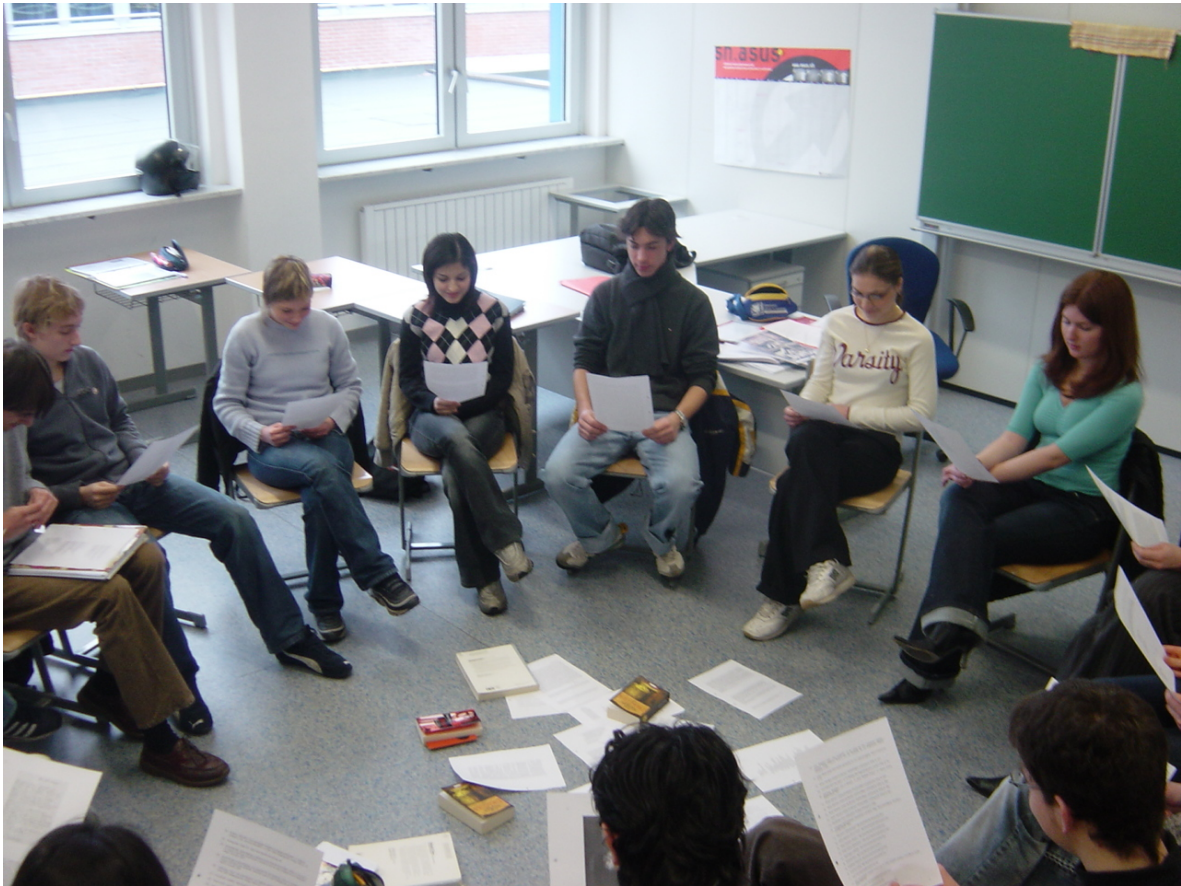
Abbildung 5.1: Arbeit mit dem Dossier Bücher/Lesen .