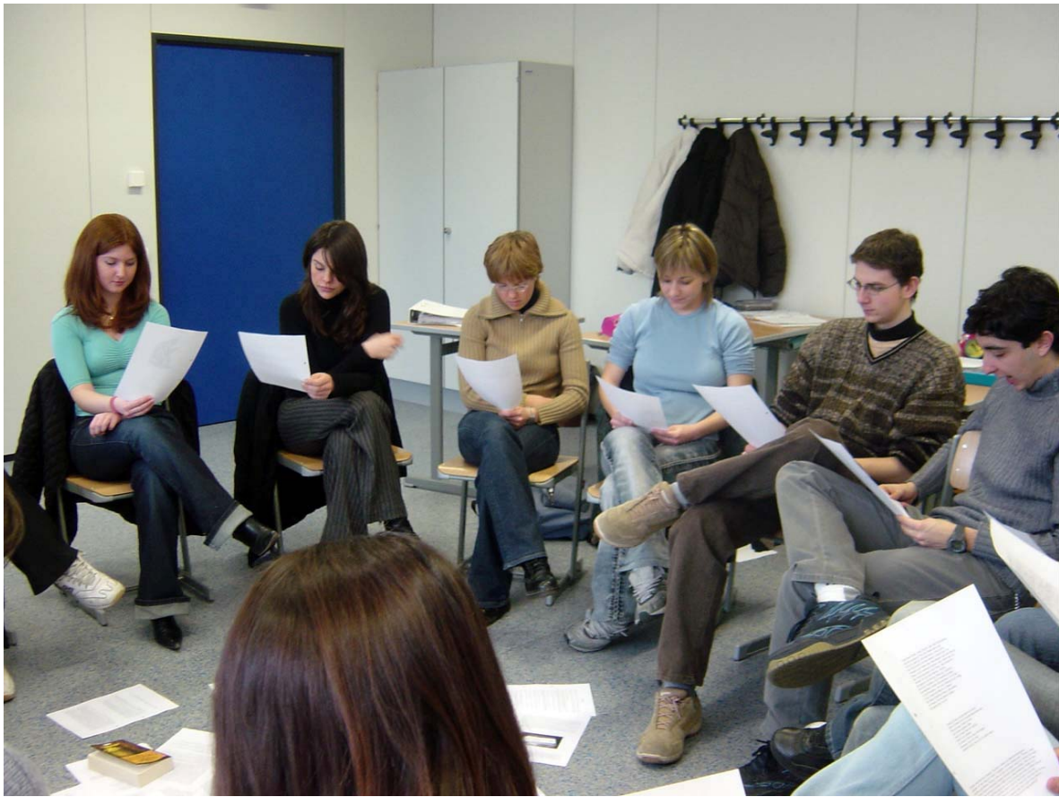
Abbildung 5.2: Arbeit mit dem Dossier Bücher/Lesen .