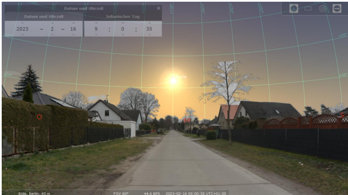
Abbildung 2: Darstellung einer in Richtung Südost verlaufenden Straße, Mitte Februar, 09:00 Uhr morgens.

Recht einfach zu beantworten ist die Fragestellung, ob Verkehrsteilnehmende an einem bestimmten Straßenpunkt oder Streckenabschnitt zu einer bestimmten Zeit geblendet werden könnten. Dazu müssen lediglich der entsprechende Zeitpunkt und die Blickrichtung eingestellt werden.