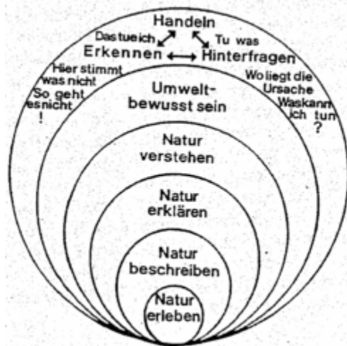
Abbildung 2: Ebenen des Naturverständnisses (Quelle: Janssen 1988, S. 5)

Naturpädagogen müssen sich dafür in den Erlebnisprozess einbeziehen, auf die Naturerfahrung einlassen und handlungsorientiertes Lernen ermöglichen.