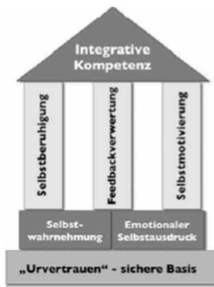
(Abbildung 1: Haus der Selbstkompetenz)

Selbstkompetenz wird hier im Weiteren als Basiskompetenz verstanden, die sich aus folgenden Bestandteilen zusammensetzt: 1. Gefühl von Vertrauen in die Welt, 2. Selbstwahrnehmung, 3. emotionaler Selbstausdruck, 4. Selbstmotivierung, 5. Selbstberuhigung, 6. Feedbackverwertung sowie 7. integrative Kompetenz. Die Beziehungen zwischen den Bestandteilen werden durch das Haus der Selbstkompetenz verdeutlicht: