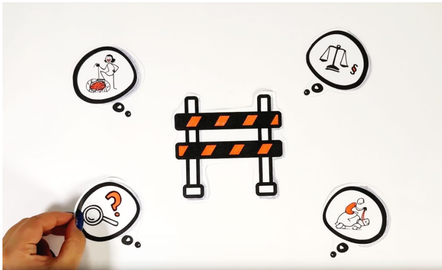
Abbildung 4 In der Beratung von Lehrenden zu OER müssen wahrgenommene Hürden abgebaut werden. (Video-Screenshot, „Eine Kultur des Teilens hochschulübergreifend durch OER voranbringen“)