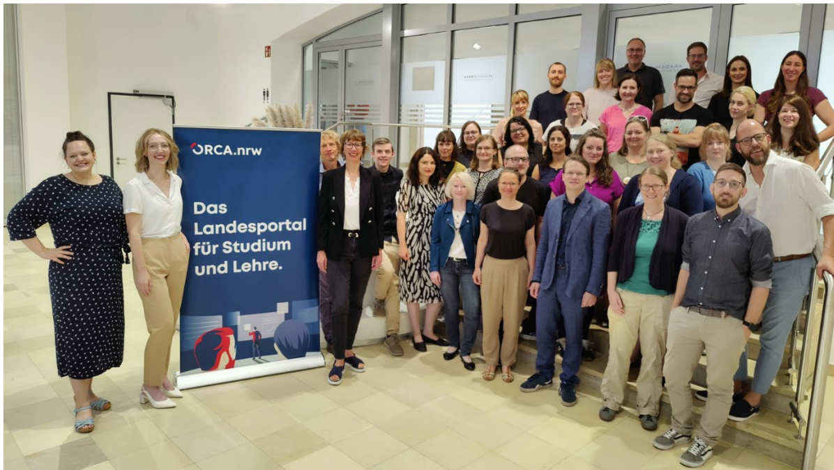
Abbildung 1 Mitarbeitende des Netzwerks bei einem Gesamttreffen in Bochum (August 2023)

Mehr als vier Jahre Netzwerkarbeit zwischen 35 von 37 Hochschulen in Nordrhein-Westfalen: Von 2020 bis Ende 2024 hat das Landesportal ORCA.nrw entscheidend dazu beigetragen, Open Educational Resources (OER) an den NRW-Hochschulen bekannter zu machen, Lehrende zur Nutzung und Erstellung eigener Materialien zu motivieren und offene Bildungspraktiken nachhaltig zu verankern. Während zu Beginn des Projekts nur wenige Lehrende mit dem Begriff „OER“ vertraut waren, haben in den vergangenen Jahren viele eigene offene Materialien erstellt. An den NRW-Hochschulen gibt es inzwischen 15 OER-Policies (Stand: Juni 2025), die diese Praxis institutionalisieren. Mit welchen Maßnahmen haben die Netzwerker*innen das Thema OER vorangebracht? Und wie hat die Zusammenarbeit innerhalb des Netzwerks dazu beigetragen, OER an den Hochschulen noch stärker zu verankern?