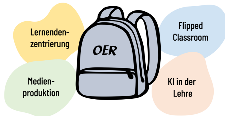
Abbildung 3 Das Thema OER kann gut auf andere Themen „aufgesetzt“ werden. (Illustration: Coco Material/Elisabeth Scherer )

diese Anbindung wird das Interesse der Lehrenden geweckt und die praktische Relevanz von OER verdeutlicht.