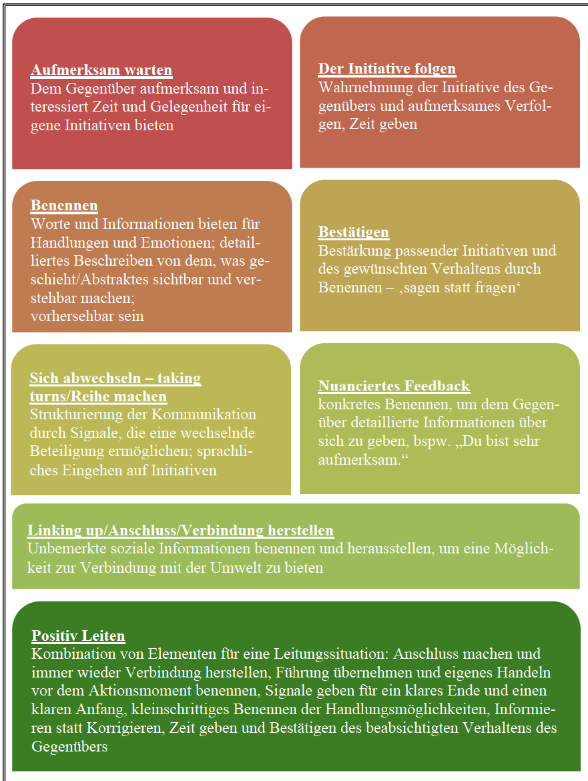
Abbildung 1 – Die Marte Meo-Elemente.