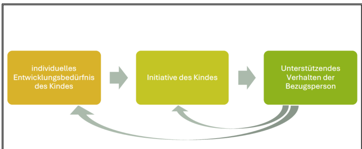
Abbildung 2 – Blickrichtung innerhalb der Videointeraktionsanalyse