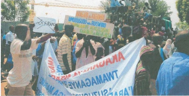
Demonstrators with banners and placards march in Kigali on November 19 to protest the arrest of Rwanda's chief of protocol Rose Kabuye by German authorities.