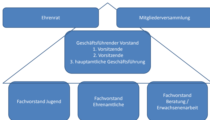
Abb. 2: Organisationsaufbau D

eigene Darstellung; Namen wurden verfremdet