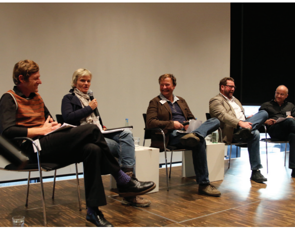
Abschlusspodium der Tagung in Köln

Am Donnerstag, den 27. Oktober 2016 fand in den Räumlichkeiten des Forums Volkshochschule in Köln die Tagung »Ideen und Praxen der Ungleichheit. Islamismus und Rechtsextremismus im Vergleich« statt. Sie wurde gemeinsam von der Info- und Bildungsstelle gegen Rechtsextremismus im NS DOK der Stadt Köln, dem Institut für Islamwissenschaft und Neuere Orientalische Philologie der Universität Bern und FORENA veranstaltet. Im Zentrum der Debatte stand die Frage nach trennenden und verbindenden Elementen von Islamismus und Rechtsextremismus