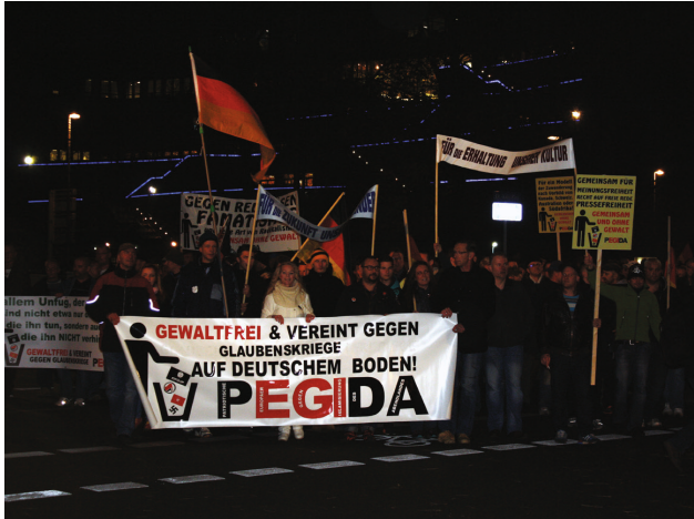
PEGIDA im November 2014.

7. Mit gezielten Falschinformationen und in hetzerischer Weise wird über das Internet Stimmung gegen Geflüchtete und die zivilgesellschaftlichen Akteur*innen der ›Willkommenskultur‹ gemacht. Zahlreiche Plattformen tragen zur Selbstbestätigung und als Mobilisierungsforen zur Zuspitzung der flüchtlingsfeindlichen und rassistischen Proteste bei.