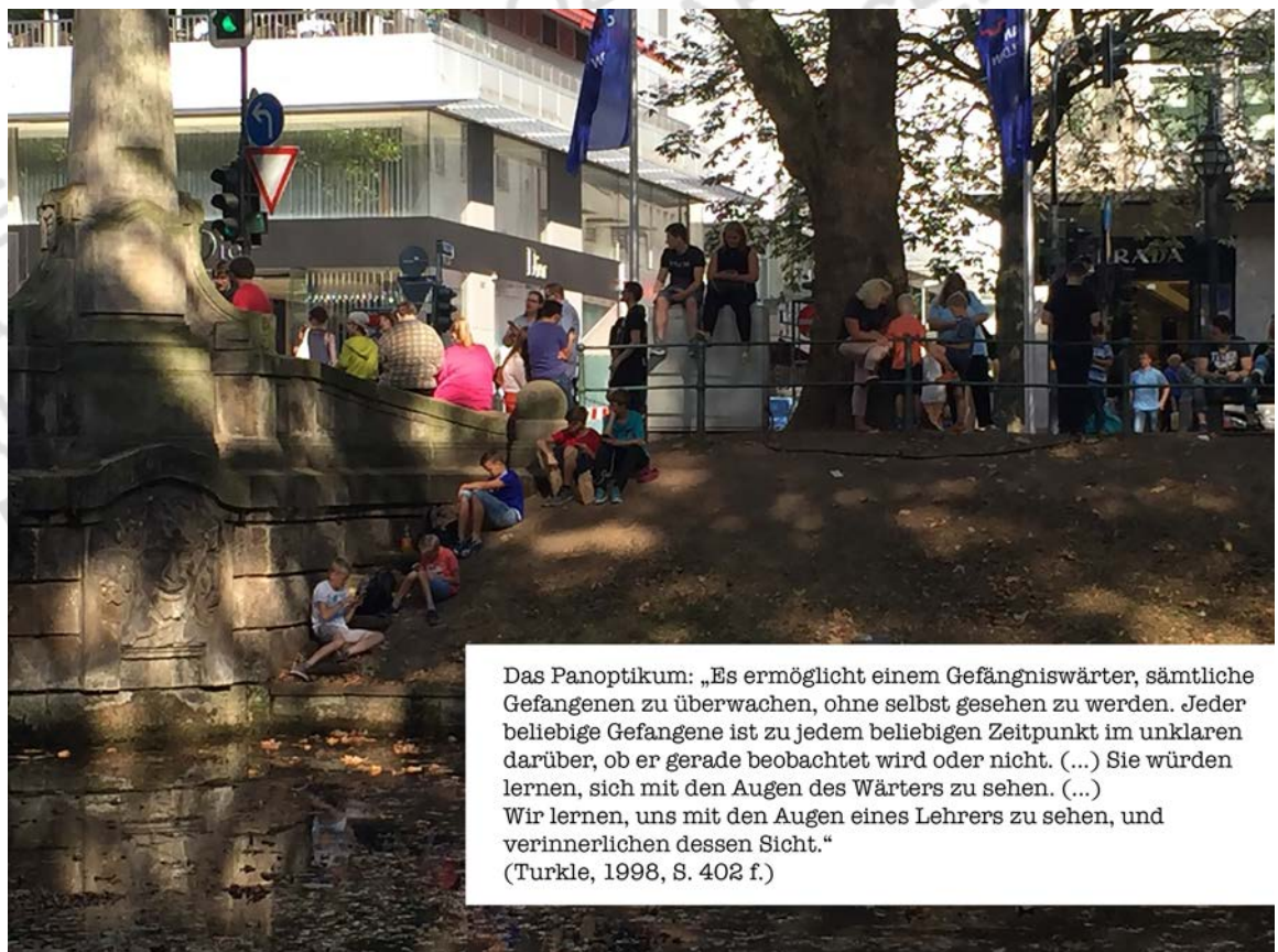
Abb. 6: PokémonspielerInnen zwischen Kö und Giradet-Brücke, 03.09.2016

Der Vorwurf der Kolonialisierung kann nicht nur auf Staaten und Institutionen angewendet werden, sondern sich ebenso gegen Unternehmen richten. In diesem Fall betrifft dies Google mit seiner proprietären Karten-Software, die als Grundlage von Pokémon Go dient. So wird die Bewegung nicht nur im materiellen Raum erzeugt sondern ebenso mittels der Karte im Spiel dargestellt. Die nahezu stufenloses Zoomen wird ein sinnliches Gefühl der Bewegung vermittelt, das dem „Herumwandern“ im Sinne de Certeaus gleicht. Die eingeschränkte Sicht des Fußgängers wird mithilfe von Googlemaps bzw. der Karte in Pokémon Go zum Blick des „Voyeurs“ der in den klaren Text der geplanten und leicht lesbaren Stadt eindringen kann. Die bereits im Mittelalter erfundene Perspektive des schwebenden Auges und seiner „alles sehenden Macht“ scheint hier nicht nur auf die panoptische Perspektive der Kartenansicht zuzutreffen, sondern kann im Zeitalter des Data-Minings metaphorisch als Beobachtungs- und Kontrollinstanz verstanden werden, die jede Handlung speichert und verarbeitet.