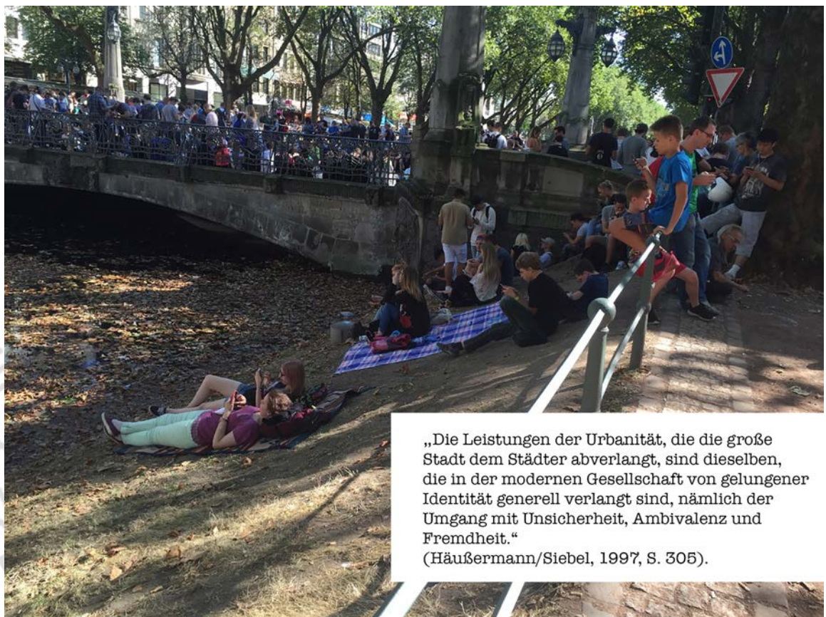
Abb. 5: Mit der Picknickdecke zur Kö, 03.09.2016

so lässt sich diese Grenzüberschreitung teilweise auf den materiellen Pokémon Go Spielraum übertragen. Sie entspinnen ein ‚Netz der Antidisziplin‘ im Sinne de Certeaus. Sie übertreten Grenzen, stehen und sitzen jenseits von Begrenzungen an Straßen, Fahrrad- und Gehwegen und sitzen auf Geländern. Die Umdeutung und Umnutzung der Orte – auf der Parkbank ruhen nun nicht mehr vom Kö-Shopping erschöpfte Besucher sondern sitzen Pokémon Go SpielerInnen, über die Brücke fahren nun keine roten Busse mit staunenden Touristen sondern sitzen Pokémon Go SpielerInnen im Klappstuhl – kann im Sinne de Certeaus als „Taktik“ beschrieben werden (Kap. 2.3.1). Der für bestimmte Handlungen vorgesehene Raum wird durch andere Handlungen, Praktiken und Platzierungen (Kap. 2.3.4) verändert. Dem gegenüber stehen die Strategien der Institutionen mit ihren Straßen, Denkmälern, Verkehrsordnungen, Denkmalschutzbestimmungen, Veranstaltungsrecht, Versammlungsrecht – kurz: Macht und Raum (Kap. 2.3.2).