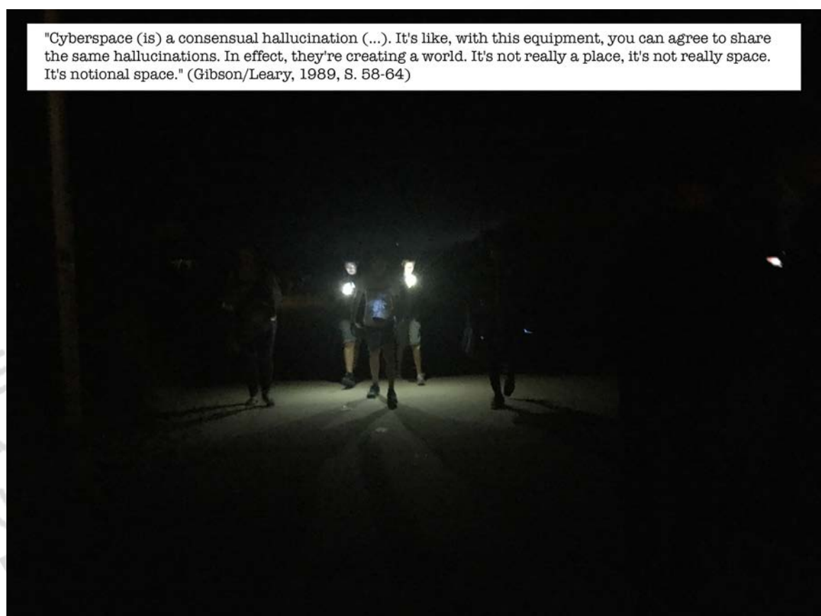
Abb. 3: Spieler am Strand in Bergen an Zee, 09.09.2016

Die Theorie von der Verinselung der Lebensräume von Kindern und Jugendlichen und damit einhergehende Diskontinuität von Raum (Kap. 2.3.3) erhält durch Pokémon Go eine neue Interpretationsebene. So kann der Raum, in dem die befragten Jugendlichen leben, durch die eigenständige, autarke Bewegung des Gehens und den sich ständig erweiternden Aktionsraum als zusammenhängend erlebt werden („Standardroute“ T 1, Z). Der Raum wird vom Körper aus konstruiert, die Orte und deren Zusammenhänge werden durch biografische Erfahrungen verknüpft. Das gleichzeitige Agieren im virtuellen Raum stellt eine Syntheseleistung dar, in der beide Welten verbunden werden (Kap. 2.3.3).