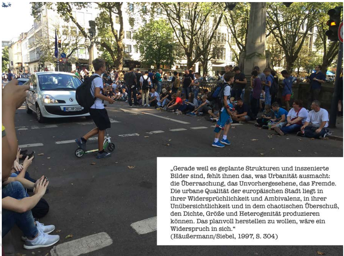
Abb. 7: Fahren und Lagern, 03.09.2016