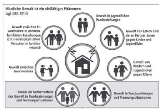
Abb. 1: Häusliche Gewalt – Fokus Partnerschaftsgewalt. (Büttner, 2020b, S. 4)

Ein besonderes Risiko, Gewalt in einer Partnerschaft zu erfahren, besteht für Frauen zum Zeitpunkt einer Trennung oder Scheidung (Schröttle & Ansorge, 2008). Jedoch kann häusliche Gewalt in allen Altersgruppen und unterschiedlichen Beziehungskonstellationen vorkommen und auch in Dauer und Intensität variieren – „in vielen Fällen [...] [erstreckt sie sich] über die gesamte Lebensspanne und sogar über Generationen 9 hinweg“ (ebd., S. 5).