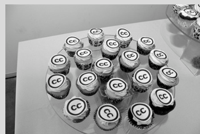
Abbildung 2: „Creative Commons 10th Birthday Celebration San Francisco“ von Timothy Vollmer, lizenziert unter CC BY 4.0 / Sättigung verringert

für ein verändertes Bild unter Creative-Commons-Lizenz