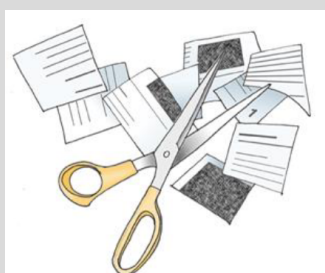
Abbildung 1: Wie wird plagiiert? (Weber-Wulf 2004)

für ein zitierbares Bild mit Quellenangabe im Kurzbeleg