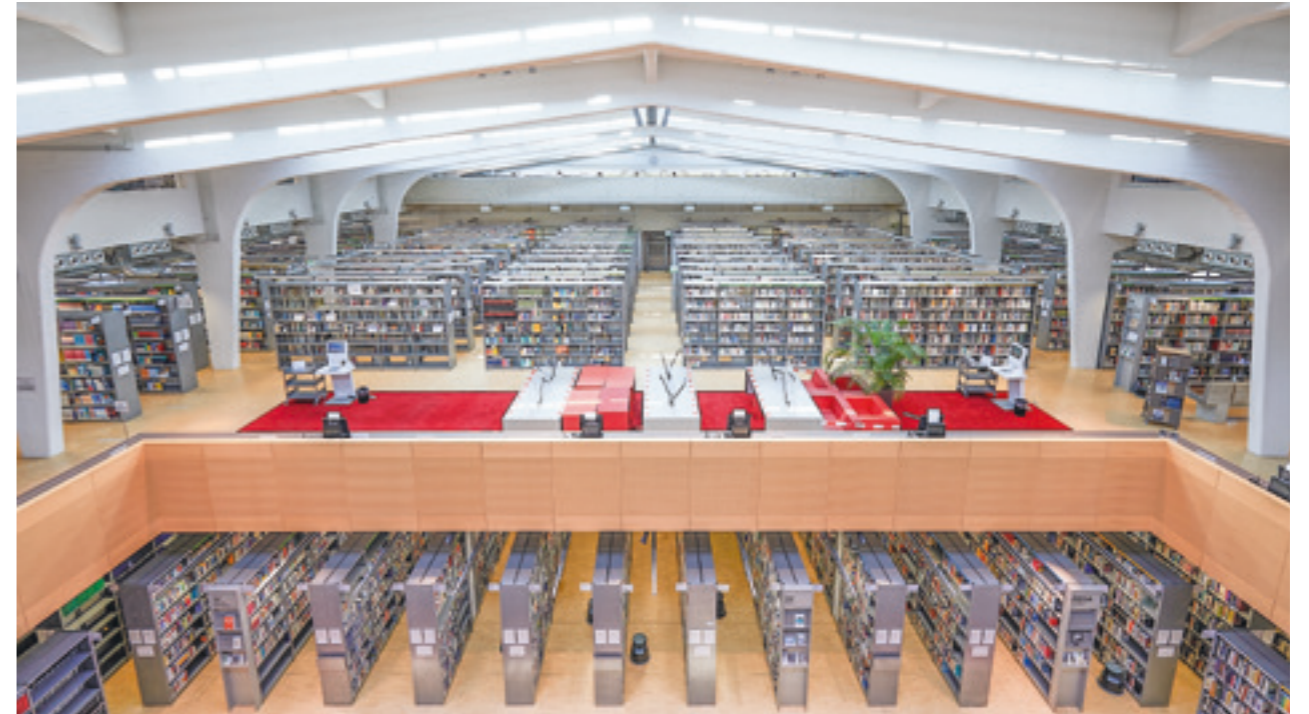
Das geschichtsträchtige Gebäude der Hochschulbibliothek der Hochschule Düsseldorf, in dem sich auch der Erinnerungsort „Alter Schlachthof“ befindet, dient auch als zentraler Lernort auf dem Campus.

An dieser Stelle soll keine allumfassende Auseinandersetzung mit der Begrifflichkeit Open Science erfolgen. Die Definition der UNESCO verdeutlicht jedoch, was in diesem Beitrag unter Open Science verstanden wird und an welchen Vorgaben sich die Hochschulbibliothek der Hochschule Düsseldorf (HSD BIB) hinsichtlich ihrer Initiativen orientiert. Maßgeblich ist, dass das Ministerium für Wirtschaft, Innovation, Digitalisierung und Energie des Landes Nordrhein-Westfalen (MWIDE NRW) »[...] den offenen Zugang zu den Ergebnissen wissenschaftlicher Forschung und die Grundprinzipien der Open Science [befürwortet]. Die Realisierung von Mehr-