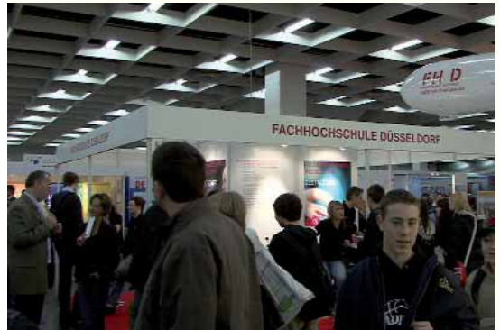
Die Fachhochschule nahm im Berichtszeitraum an zahlreichen Schülermessen teil und konnte ihr facettenreiches Studienangebot einer breiten Öffentlichkeit ebenso wie potenziellen Studierenden bekannt machen.