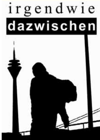
Innerhalb ihrer Abschlussarbeiten zum Thema Obdachlosigkeit in Düsseldorf verbrachten zwei Studierende des Fachbereichs Sozial- und Kulturwissenschaften fünf Tage auf der Straße. Der hierbei entstandene Film »Irgendwie dazwischen« zeigt exemplarisch Stationen des städtischen Hilfesystems auf, beleuchtet aber auch das alltägliche Leben der Obdachlosen, deren Sorgen und Probleme einer breiten Allgemeinheit oft unbekannt sind.