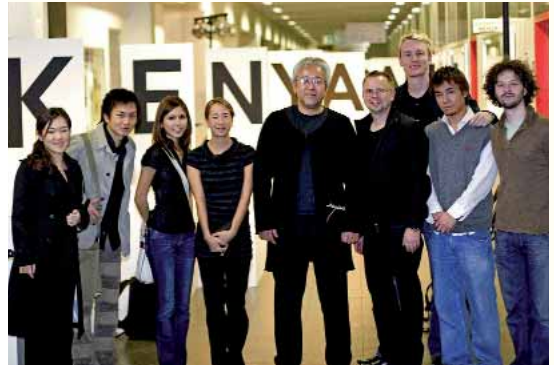
Der bedeutende japanische Designer Kenya Hara besucht im Wintersemester 2007/2008 die Fachhochschule Düsseldorf. Neben einem Vortrag waren in einer Ausstellung auch einige seiner wichtigsten Werke zum ersten Mal in Deutschland zu sehen.

Viele Studierende und Lehrende reichen ihre Arbeiten bei nationalen und internationalen Wettbewerben ein, zum Beispiel ADC, Red Dot, DDC oder TDC N.Y.. Der Fachbereich wird dabei regelmäßig ausgezeichnet und nimmt im Ranking der Ausbildungsinstitute eine Spitzenstellung ein. Mehrere Dozenten und Professoren des Fachbereichs wurden als Jurymitglieder für verschiedene Wettbewerbe und Stipendienvergaben nominiert.