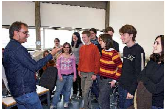
Viele interessierte Schülerinnen und Schüler konnten durch zahlreiche Informationsveranstaltungen der Hochschule – wie hier am Fachbereich Elektrotechnik – für ein praxisorientiertes Studium begeistert werden.

Die Zahl der Absolventen der Fachhochschule insgesamt im Studienjahr 2007/2008 ist im Vergleich zum Vorjahr von 911 auf 1.022 angestiegen, was vor allem durch die Absolventen der auslaufenden Diplom-Studiengänge begründet ist. Im Fachbereich Architektur absolvierten 199 Studierende, im Fachbereich Design 173, in der Elektrotechnik 46, in Maschinenbau und Verfahrenstechnik 91, im Fachbereich Medien 40, in den Sozial- und Kulturwissenschaften 262 und im Bereich Wirtschaft 211.