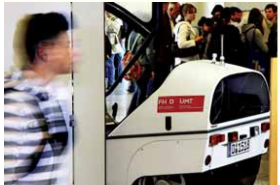
Beim Tag der Technik in der Düsseldorfer Handwerkskammer beteiligte sich die Fachhochschule als Mitorganisator ein weiteres Mal mit einem breit aufgestellten Präsentationsprogramm, das einen Überblick über die technischen Lehr- und Forschungsgebiete bot.