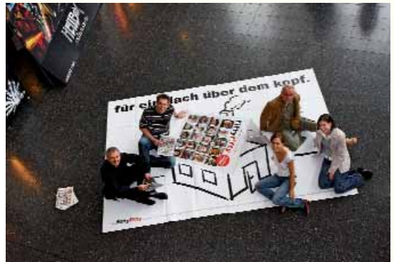
Im Sommersemester 2008 präsentierten Studierende ihre Plakatentwürfe für das fiftyfifty-Magazin, mit dem sie auf Obdachlosigkeit aufmerksam machten und gleichzeitig für die Zeitschrift warben: Social Design - Gute Ideen für gute Taten