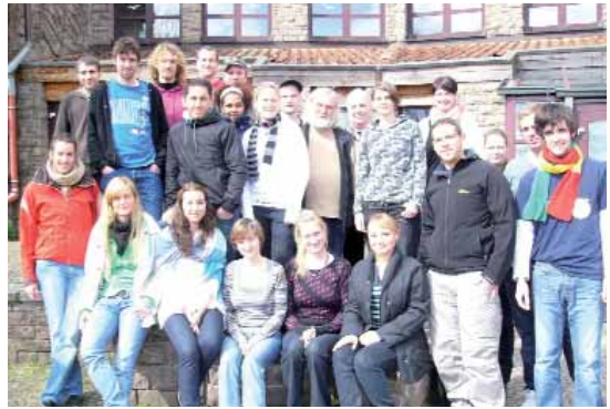
Auf Einladung der Katholischen Landjugend und der Pfarrgemeinde aus Schwerfen in der Eifel erstellte eine Studierendengruppe eine Dorfanalyse, um Anhaltspunkte für die künftige Dorfentwicklung zu finden.

Im Berichtszeitraum wurde auch die Alumni-Arbeit des Fachbereichs intensiviert und systematisiert. Zum 10-jährigen Bestehen des Fördervereins ist für Herbst 2009 eine Fachtagung zur »Ökonomisierung der Sozialen Arbeit« geplant.