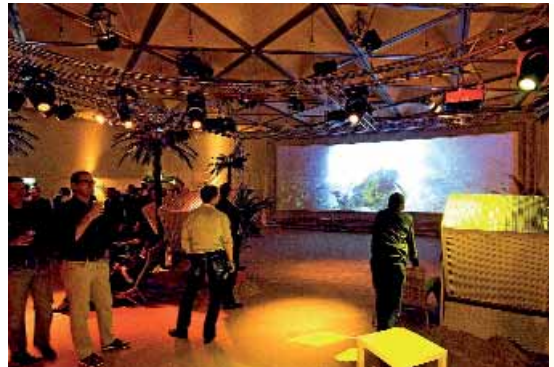
Studierende und Lehrende des Fachbereichs Medien beteiligten sich auch im vergangenen Studienjahr wieder an der weltgrößten Wassersportmesse „boot“ im Düsseldorfer Messegelände. Unter dem Motto „Beach and Bytes“ präsentierten sie einen mit neuester multimedialer Unterhaltungstechnik ausgestatteten Veranstaltungsraum.

Das Renommée der Fachhochschule Düsseldorf soll durch häufige Gutachtertätigkeiten ihrer Professoren für externe wissenschaftliche Arbeiten verstärkt werden. Professoren und Dozenten, die als Gutachter der Deutschen Forschungsgemeinschaft (DFG) tätig sind, werden seit 2004 durch zusätzlich von der Hochschule eingestellte Hilfskräfte unterstützt.