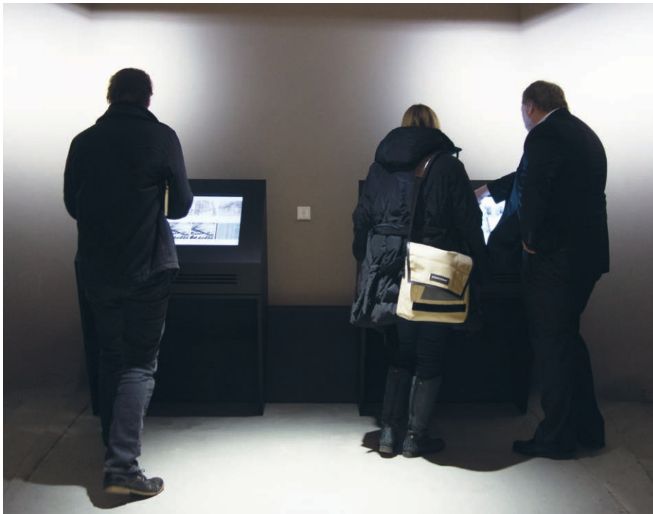
An den Medienstationen des Digitalen Archivs