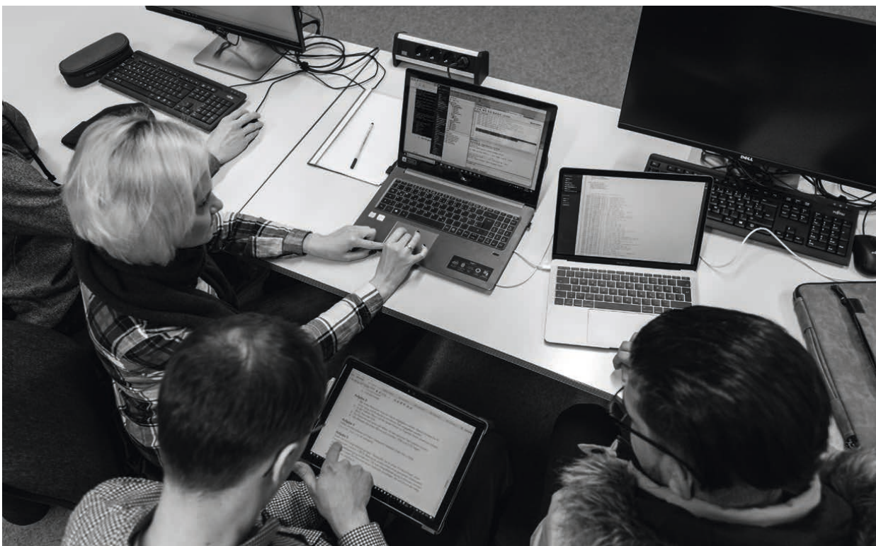
Beim gemeinsamen Engineering der Software

Darüber hinaus werden datenbankspezifische Elemente wie Indizes oder gespeicherte Prozeduren (stored procedures) auch in UML modelliert. Elemente aus Programmiersprachen wie die Vererbung lassen sich ebenfalls zur Datenbankmodellierung nutzen. Dadurch wird die Abbildung der Modellierung in UML auf die Implementierung im Datenbankschema in beide Richtungen automatisiert – und das bei gefüllter Datenbank. Dadurch werden die verschiedenen Ebenen der Anwendung konsistent gehalten.