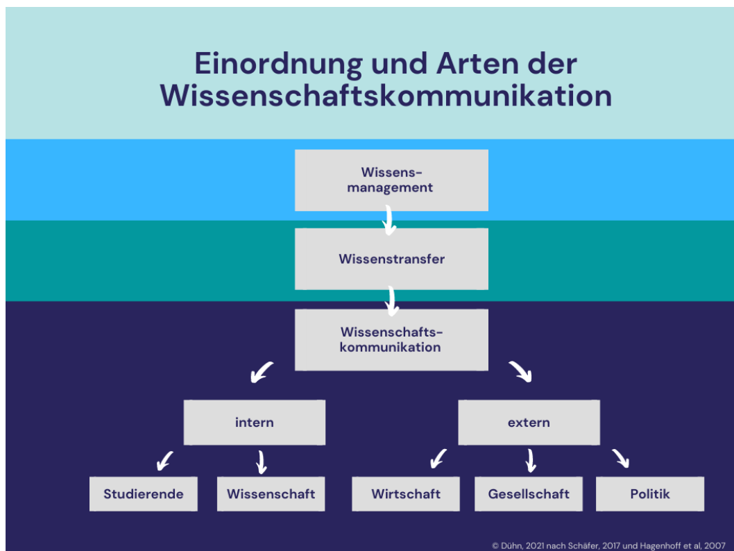
Abbildung 3: Einordnung und Arten der Wissenschaftskommunikation (© Dühn, 2021 nach Schäfer, 2017 und Hagenhoff et al, 2007)

Wissenschaftskommunikation findet hauptsächlich von der Forschung in Richtung Öko-Praxis statt, kann aber auch Rückkopplung und Austausch ermöglichen, z.B. auf Feldtagen oder in den Sozialen Medien.