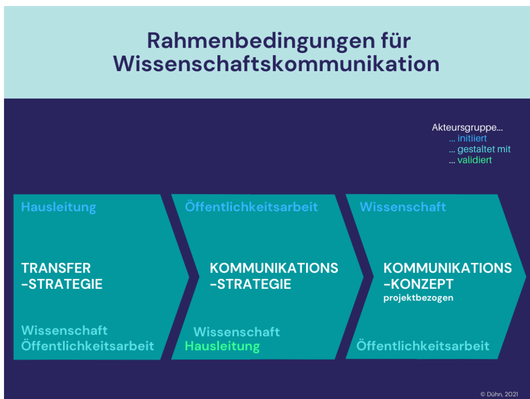
Abbildung 5: Rahmenbedingungen für Wissenschaftskommunikation (Dühn, 2021)

Damit das Potenzial der Wissenschaftskommunikation hin zur Öko-Praxis oder anderen externen Zielgruppen genutzt werden kann, ist zu empfehlen, gewisse Rahmenbedingungen zu schaffen. Abbildung 5 zeigt einen Weg auf, wie dies realisiert werden kann.