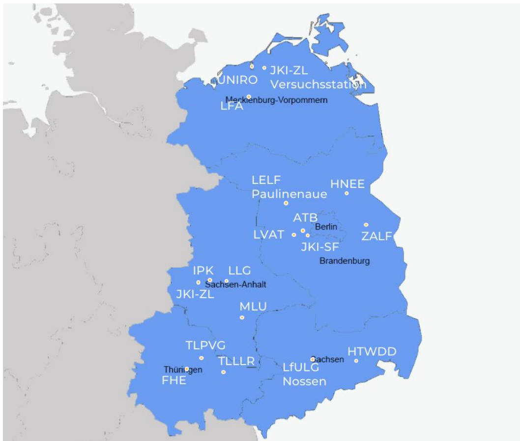
Abbildung 2: Öffentlich finanzierte Einrichtungen mit Öko-Forschung im Osten Deutschlands (Dühn, 2021)

Öffentlich finanzierte Forschungshäuser erhalten eine Basisfinanzierung seitens Bund oder Ländern oder beiden. Es wurde angenommen, dass daher die Wissenschaftskommunikation besser gesichert werden kann, als bei rein projektfinanzierter Öko-Forschung. Dazu in Kapitel 2.2. mehr.