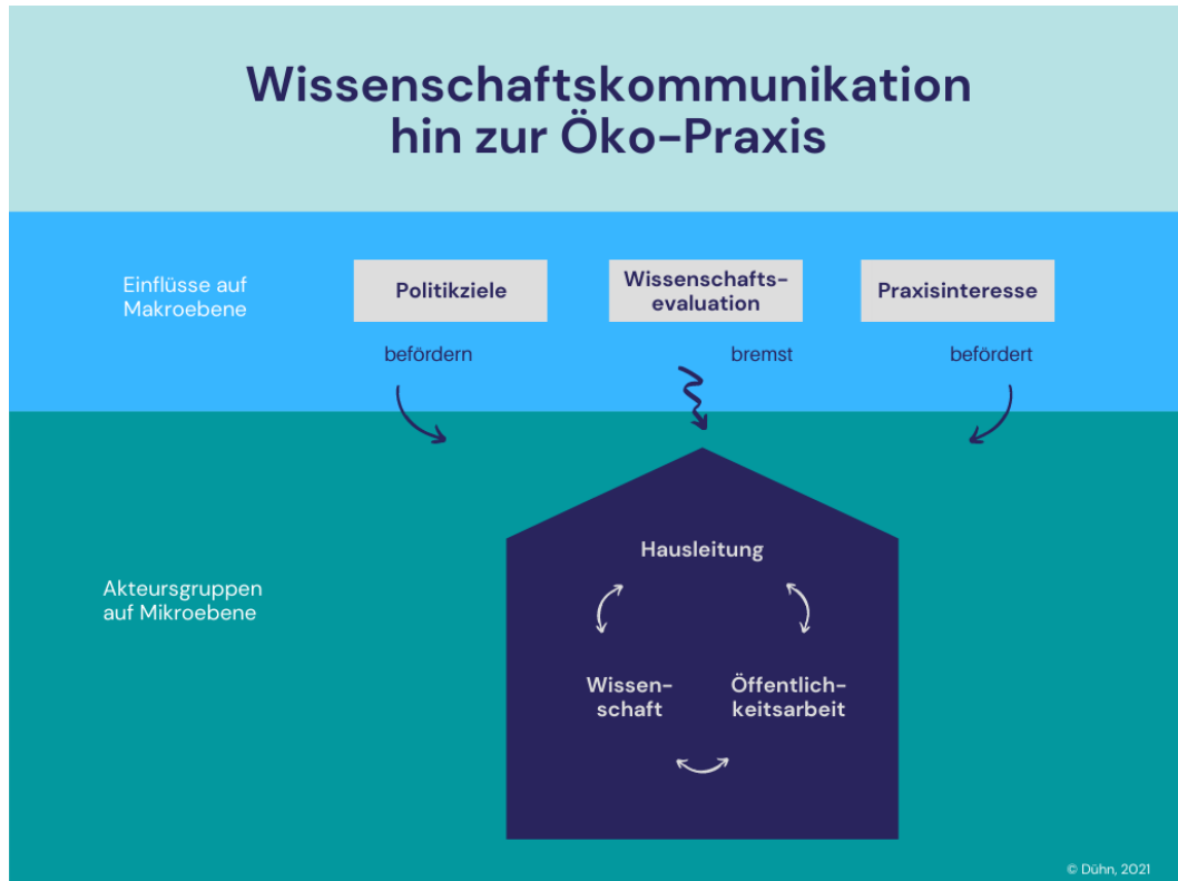
Abbildung 1: Einflüsse und Akteur*innen der Wissenschaftskommunikation zur Öko-Praxis (Dühn, 2021)

Doch bevor der Blick vertieft wird, soll das nachfolgende Schema (Abbildung 1) bereits die Zusammenhänge und Akteur*innen in der Wissenschaftskommunikation verdeutlichen. In Kapitel 2.2. und 2.3. wird darauf näher eingegangen.