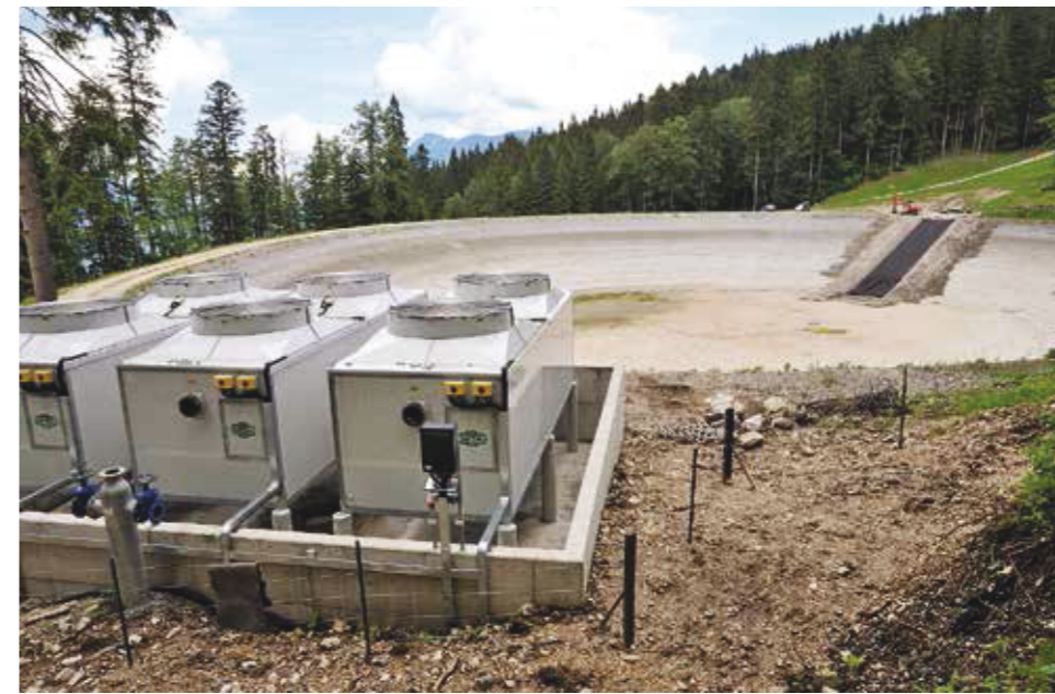
Die Beschneigung erfordert den Bau von Speicherbecken und Kühltürmen

Betrachtet man dagegen – unabhängig von der Differenzierung zwischen Naherholung und Tourismus