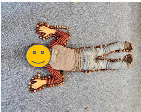
Abbildung 1: Umriss mit Kastanien

Weiterführende Ideen zum Body-Scan sowie zur Körperwahrnehmung sind beispielsweise, den Körper gegenseitig mit Kastanien zu umranden oder mit anderen Materialien die Körperkonturen nachzulegen.