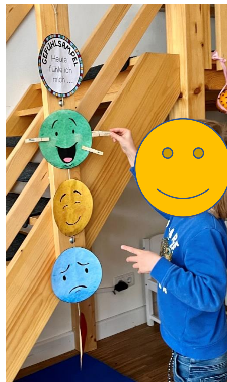
Abbildung 4: Gefühle zeigen und benennen

Innerhalb der Übung wurden die unterschiedlichen Emotionsfarben der Gefühlsampel zusammen mit der Vorschulgruppe besprochen. Dabei ist die Gruppe gefragt worden, welche Gefühle sie schon kennen und in welcher Situation sie diese bereits erlebt oder bei anderen gesehen haben. Anschließend durften die Kinder mit personalisierten Wäscheklammern ihren momentanen Gefühlszustand festhalten. Je nach Bedarf, gaben die Kinder auch noch weitere Details über die Gründe ihrer derzeitigen Befindlichkeiten preis. Auch nach der Übung findet die Gefühlsampel tägliche Anwendung im Alltag des inklusiven Montessori Kinderhauses.