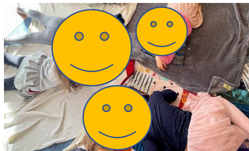
Abbildung 10: Fantasiereise im Liegen

Fantasiereisen sowie Entspannungsübungen mit Kindern können alternativ auch ohne Weiteres im Liegen ausgeführt werden.