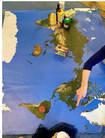
Woher kommen unsere Lebensmittel?