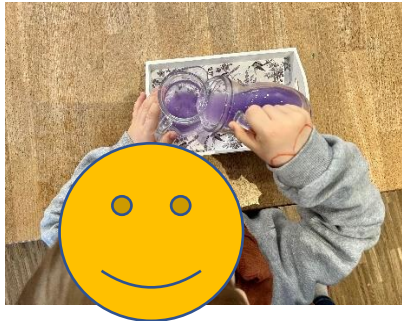
Gießen von Flüssigkeiten