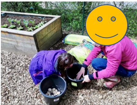
Pflanzen von Kartoffeln