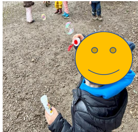
Abbildung 7: Liebevolle Gedanken verschicken

Die Übung Liebe Gedanken verschicken ist aus dem Buch Achtsamkeit. Fantastische Übungen, die Kindern Ruhe schenken von Wynne Kinder zu entnehmen. Darin finden sich ebenso ergänzende Ideen zur oben genannten Übungseinheit und zusätzliche Achtsamkeitsübungen aus dem Achtsamkeitsprojekt.