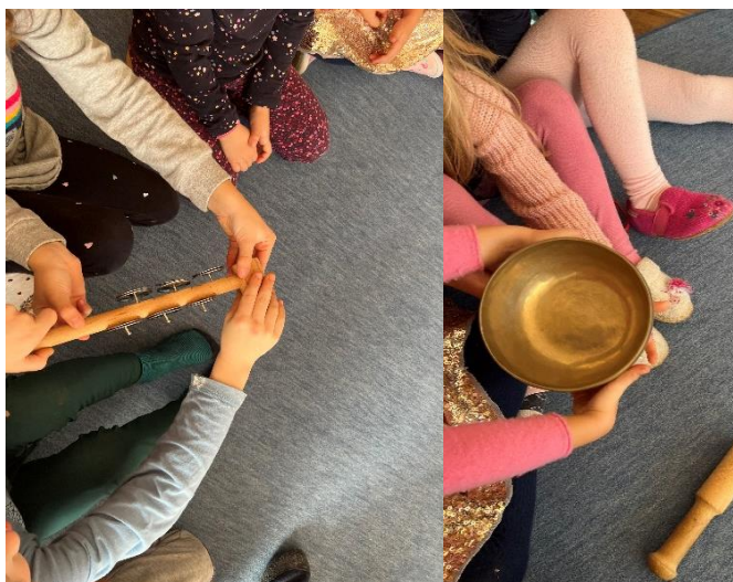
Abbildung 6: Achtsam ein Tambourin oder eine Klangschale weitergeben

Eine gute Einstiegsübung, um das achtsame Miteinander und die Gruppendynamik zu unterstützen ist die Übung Ein Tambourin weitergeben , welche aus den Montessori-Übungskarten von Marie Laschitz hervorgeht. Bei dieser Übungseinheit wird, wie der Name schon verrät, ein Tambourin behutsam und achtsam reihum im Kreis weitergegeben ohne, dass dabei ein Geräusch entsteht. Wann immer ein Läuten oder Klirren zu hören ist, beginnt die Runde von Neuem. Wenn die Kinder eine ganze Runde geschafft haben, wird die Klangschale dreimal zum Klingen gebracht. Die Übung schult die Konzentration und trainiert zugleich die Feinmotorik. Darüber hinaus kann die Übung auch mit einer Klangschale durchgeführt werden.