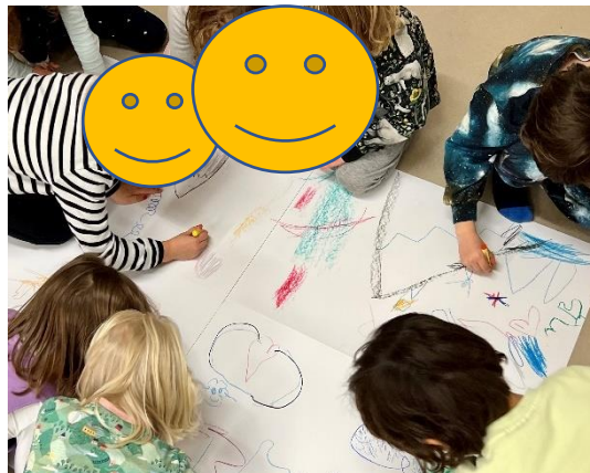
Abbildung 8: Gemeinsam ein Bild malen

Im Rahmen der Übungseinheit „Achtsamkeit und Kreativität“ durften die Kinder gemeinschaftlich ein Bild malen. Dafür wurden zuvor alle Malutensilien auf dem Boden vorbereitet. Während dem Malen saßen die Kinder, ums große Blattpapier drumherum.