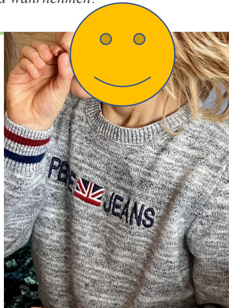
Abbildung 11: Rosinenmeditation

Wenn einzelne Kinder keine Rosinen mögen, können stattdessen auch Nüsse oder andere kleine Lebensmittel verwendet werden.