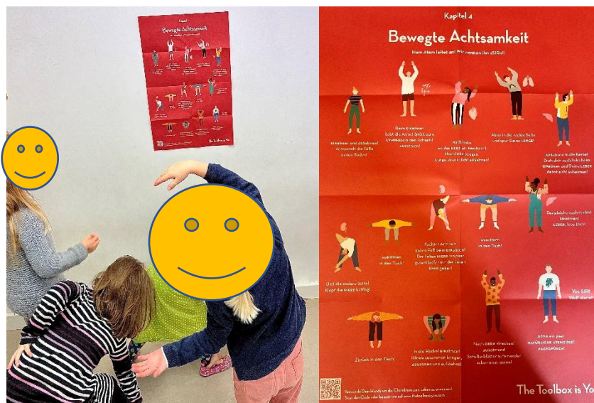
Abbildung 3: Bewegte Achtsamkeit

Die Übungseinheit zur „Bewegten Achtsamkeit“ wurde aus dem Buch The Toolbox is you von Maria Kluge und Heidemarie Dobner herangezogen. Mit der folgenden Übung lernen die Kinder, gezielt in ihren Körper hinein zu atmen, ihn zu spüren und mit Energie aufzuladen. Die Konzentration auf die einzelnen Organe unterstützt zudem, deren Aktivität und hilft den Kindern sich und ihren Körper besser wahrzunehmen. Während der Durchführung wurde, das dem Buch beigelegte Poster als praktische Anleitung genutzt (vgl. Kluge, Dobner 2018, S. 47ff.).