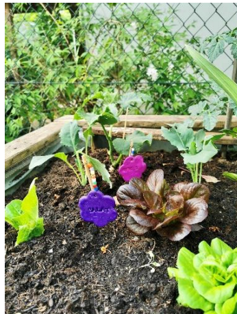
Pflegen von Pflanzen