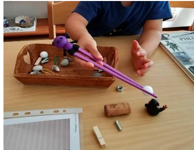
Zuordnen von Gegenständen