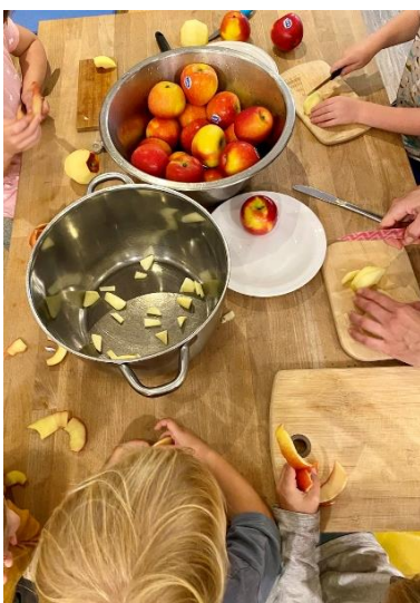
Gemeinsam Äpfel schneiden für die Zubereitung von Apfelmus