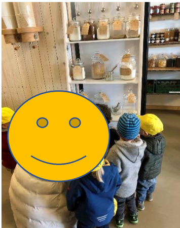
Besuch in „Resis-unverpackt Laden“