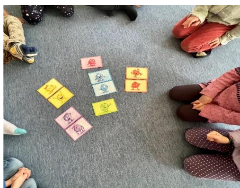
Abbildung 5: Gefühle in Bildkarten erkennen

In einer zusätzlichen Übungseinheit sind Bildkarten verwendet worden, die die Kinder dabei unterstützen sollen, ihre Emotionen noch genauer zu identifizieren. Hierbei wurden verschiedenste Gefühle, wie Freude, Wut, Angst, Traurigkeit oder Ekel durch Bildkarten dargestellt.