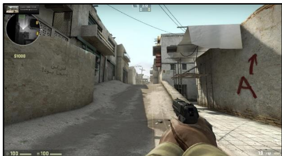
Abbildung 3: Counter Strike: Global Offensive (Valve Corporation 2023)

halten und user*innengenerierte Inhalte (UGC) entziehen sich die Spiele der Kontrolle des Anbieters. Zudem können sich Spielinhalte häufig durch Patches und Mods ändern. Eine Regulierung und Beurteilung dieser dynamischen Inhalte sind dadurch nur punktuell möglich. (Vgl. Weigand und Mühlberger 2014)