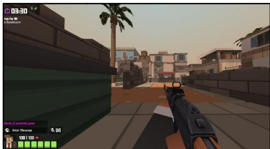
Abbildung 2: Krunker.io