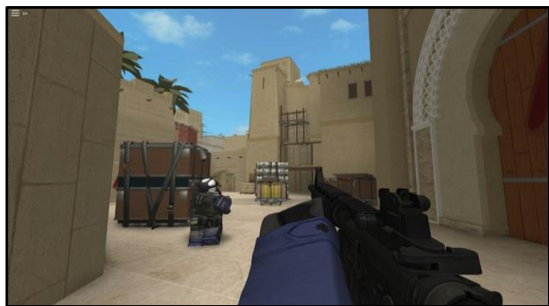
Abbildung 1: Roblox Counter-Blox (Roblox 2023)

Durch die steigende Popularität mobiler Endgeräte und Online-Games wird eine inhaltliche Beurteilung immer schwieriger. Auch die Altersfreigabe durch die USK gerät an ihre Grenzen. Durch den ständigen Wandel von Online-In-