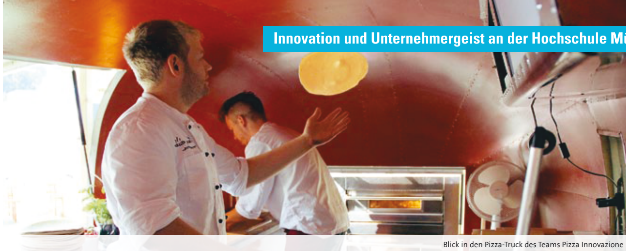
Blick in den Pizza-Truck des Teams Pizza Innovazione