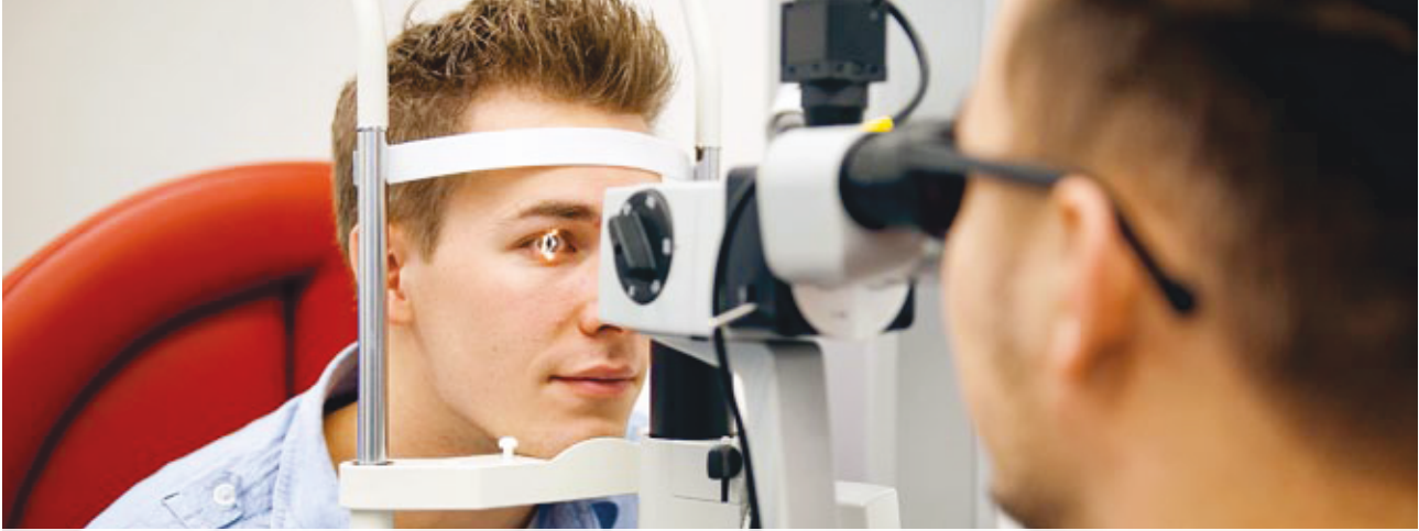
Untersuchen, messen und protokollieren – im Sehlabor können die Studierenden ihr Wissen praktisch anwenden