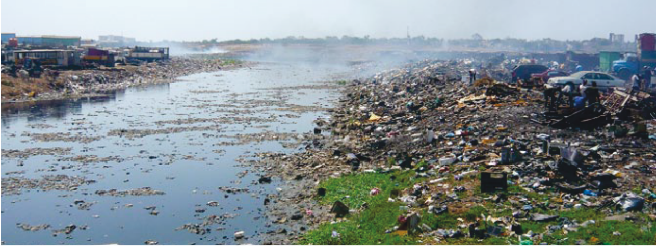
Abfall soweit das Auge reicht: Bedrückender Blick auf einen Teil des »Elektro-Friedhofs« in Agbobloshie