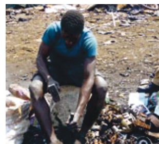
Demontage mit Hammer und Meißel

Batterien sind gefragte Handelswaren. Mit dem Erlös ernähren sie häufig ihre ganze Familie. Zeit für Schulbesuche oder eine Ausbildung bleibt da nicht. Doch es besteht noch ein viel drängenderes Problem: Bei der Demontage treten krebserregende Dämpfe und Flüssigkeiten aus einem giftigen Chemikaliencocktail aus, darunter Arsen, Kadmium, Chrom, Blei oder Nickel. »Ich selbst hatte dicke Wanderschuhe an, die Jugendlichen oft nur Sandalen«, sagt Isenmann. Die meisten waten sogar barfuß durch den giftigen Schlamm. »Früher sah man dort eine tolle Lagunenlandschaft – heute ist nur noch ätzend-stinkende Kloake übrig«, erklärt er.