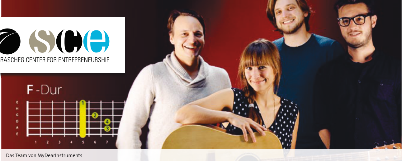
Das Team von MyDearInstruments