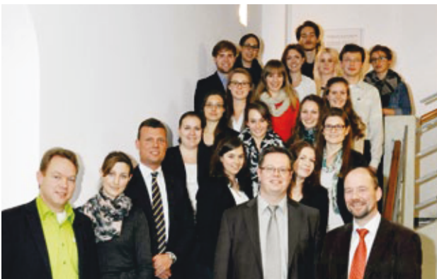
ProjektteilnehmerInnen mit den VertreterInnen der Busunternehmen

Studierende untersuchten die Attraktivität von Fernbuslinien bei ihren Münchner KommilitonInnen. Seit dem 1. Januar 2013 ist das Monopol der deutschen Bahn für die Streckenrechte aufgelöst. Somit können private Unternehmen in Deutschland neue Fernbuslinien betreiben, auch wenn diese parallel zu Bahnstrecken verlaufen. So hat sich laut dem Kompass Mobilität – Fokus Fernbus 2013 des IGES Instituts seit Beginn der Neuregelung die Zahl der Fernbus-Städteverbindungen verdoppelt und das Angebot bereits verdreifacht.