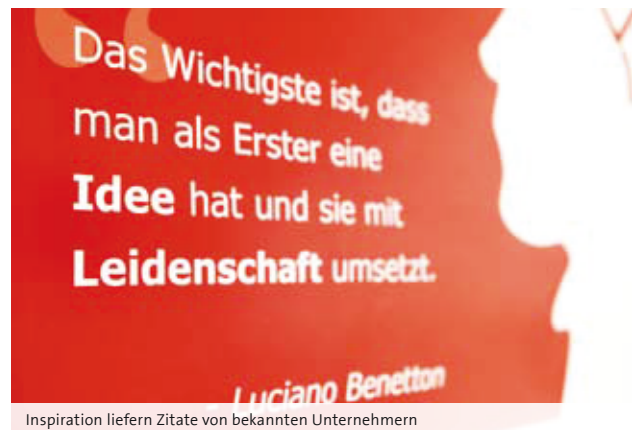
Inspiration liefern Zitate von bekannten Unternehmern