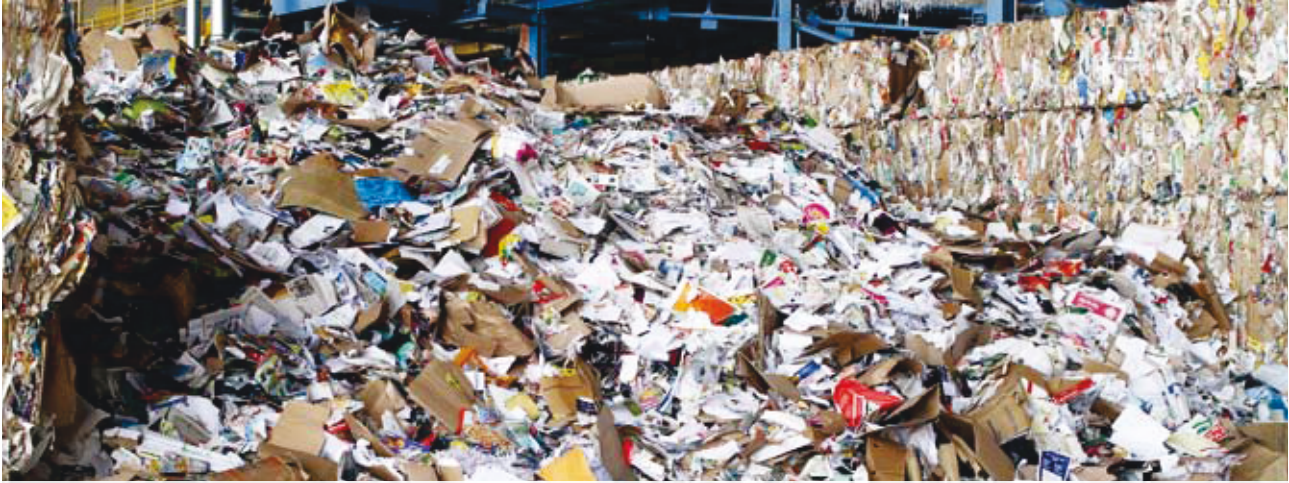
Eindrucksvolle Altpapier-Berge türmen sich vor der Papierrecyclinganlage in Dachau – die gilt es zu sortieren