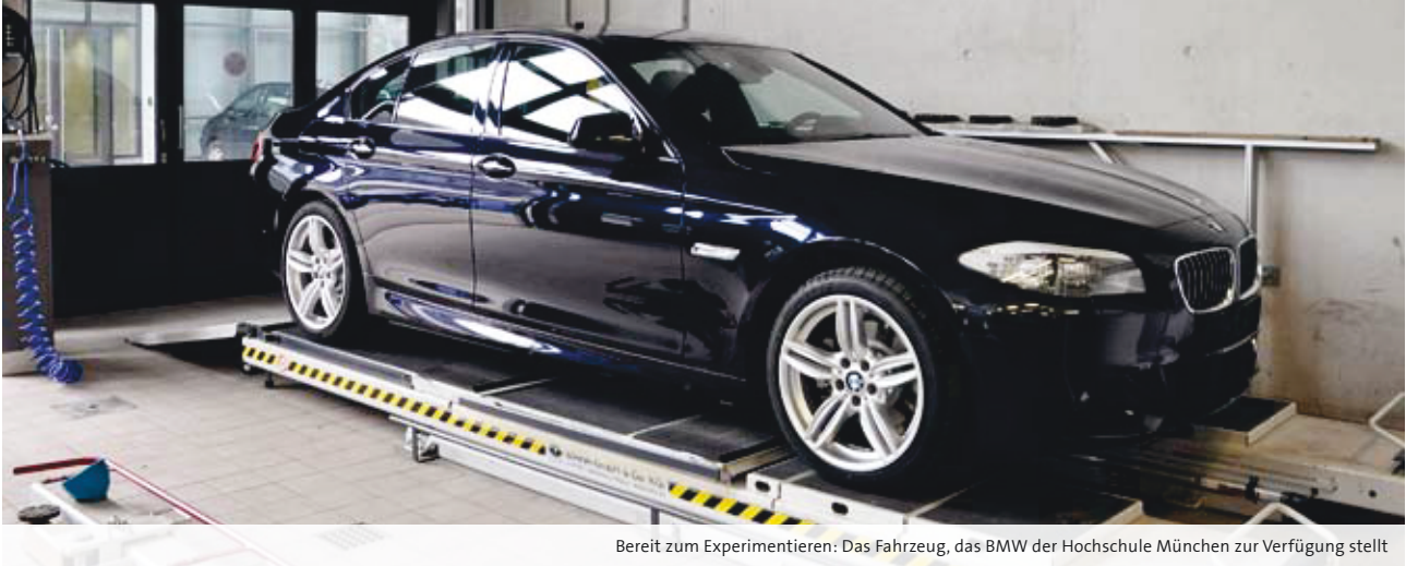
Bereit zum Experimentieren: Das Fahrzeug, das BMW der Hochschule München zur Verfügung stellt