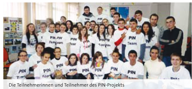
Die Teilnehmerinnen und Teilnehmer des PIN-Projekts

Gelegenheit, mehr über ihre Gemeinde zu erfahren, und den SeniorInnen wurden Würde und Respekt für ihre Lebensleistungen entgegengebracht. Im Dezember 2012 waren die Ergebnisse in einer Ausstellung in Nadrag zu sehen, ab Mitte Mai wird die Ausstellung an der UdV in Timisoara gezeigt.