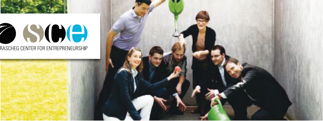
Besser als gießen: Die SCE-Gründungsförderung unterstützt alle, die eigene unternehmerische Projekte vorantreiben, entscheidend sind Neuheitsgrad und Engagement