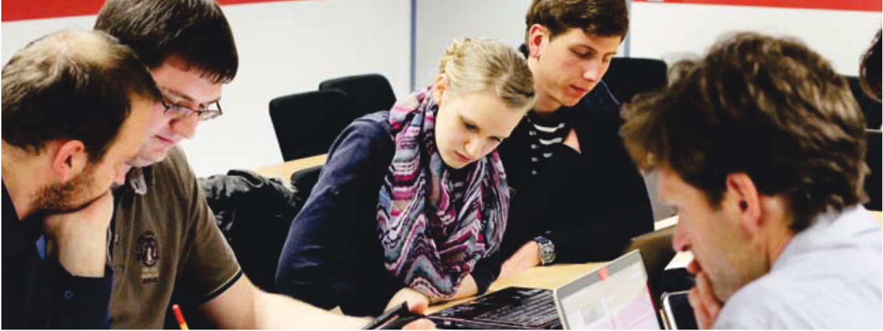
Grübeln über Logistikfragen: Studierende beim Logistik Masters-Wettbewerb, Foto: Anne Puhlmann