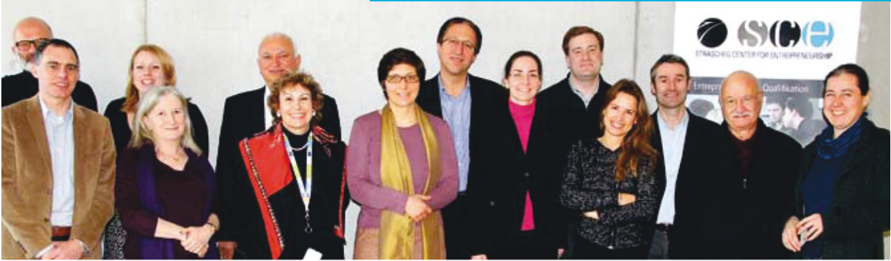
Partner von »Coneect« sind neben der Hochschule München die Universitäten von Aberdeen, Tel Aviv, Sofia und Lissabon sowie der Projektträger Jülich, Berlin