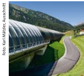
Ausschnitt