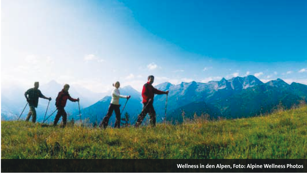
Wellness in den Alpen, Foto: Alpine Wellness Photos