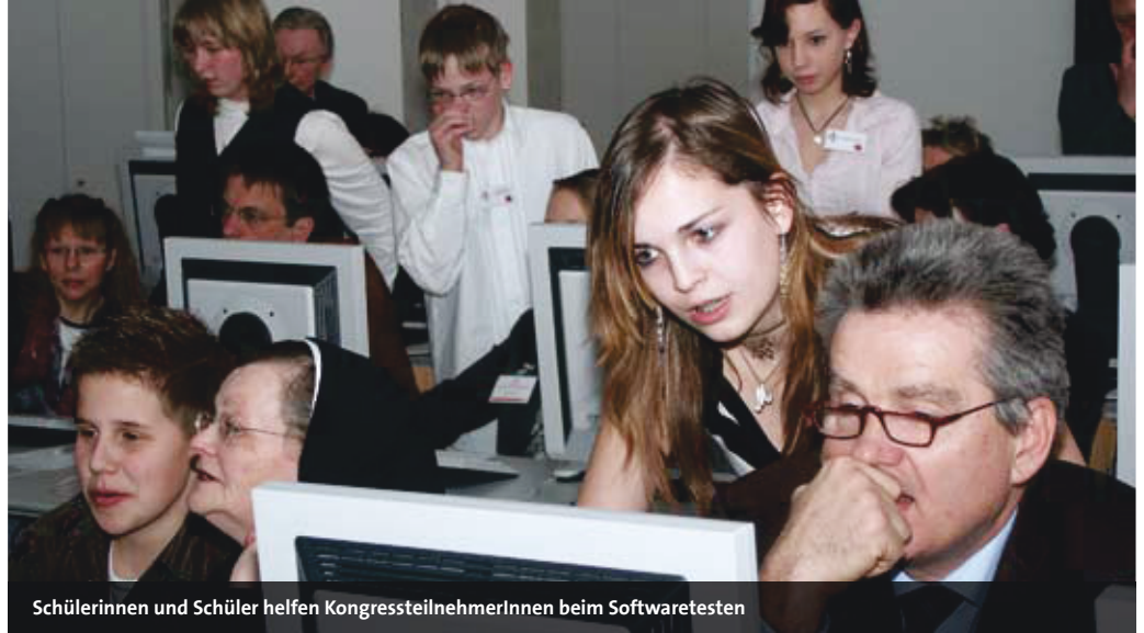
Schülerinnen und Schüler helfen KongressteilnehmerInnen beim Softwaretesten