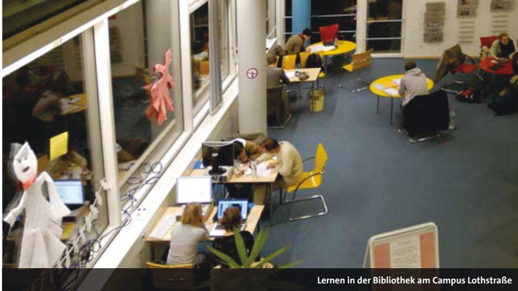
Lernen in der Bibliothek am Campus Lothstraße