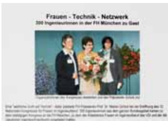
Netzwerktreffen von Ingenieurinnen an der FH München