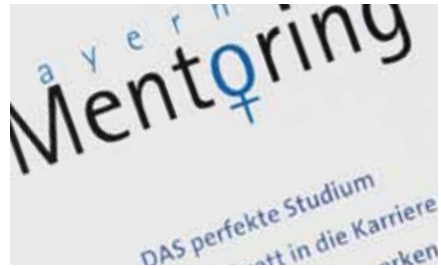
Flyer zum Bayern Mentoring (Ausschnitt)

»Wir [haben] die Damen zusammengeführt [...], das war eine gegenseitige Win-win-Situation.« (Interview IHJ, 14:00)