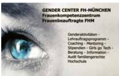
Infokarte des Gender Centers