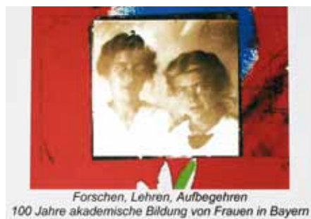
Plakat zur Ausstellung 100 Jahre akademische Bildung von Frauen in Bayern (Ausschnitt)

In einer Zeit, in der an vielen Fachbereichen Professorinnen noch eine Ausnahmeerscheinung waren, wenn nicht allein auf weiter Flur wirkten, stellten diese zwanglosen Treffen, bei denen die Kolleginnen der Hochschule München fachbereichsübergreifend zusammenkommen konnten, eine wichtige Starthilfe für die Neuberufenen und eine Stärkung des Netzwerks aller Kolleginnen dar.