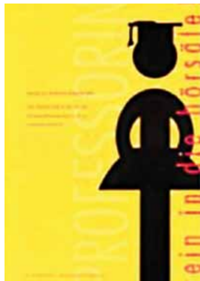
Poster zum Projekt rein in die hörsäle!