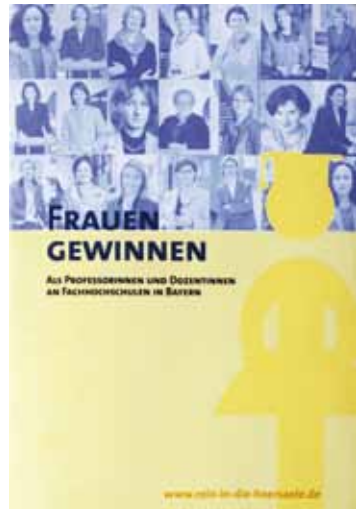
Broschüre zum Projekt rein in die hörsäle!