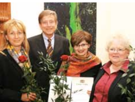
Verleihung des Gleichstellungspreises an die FH München, 2005