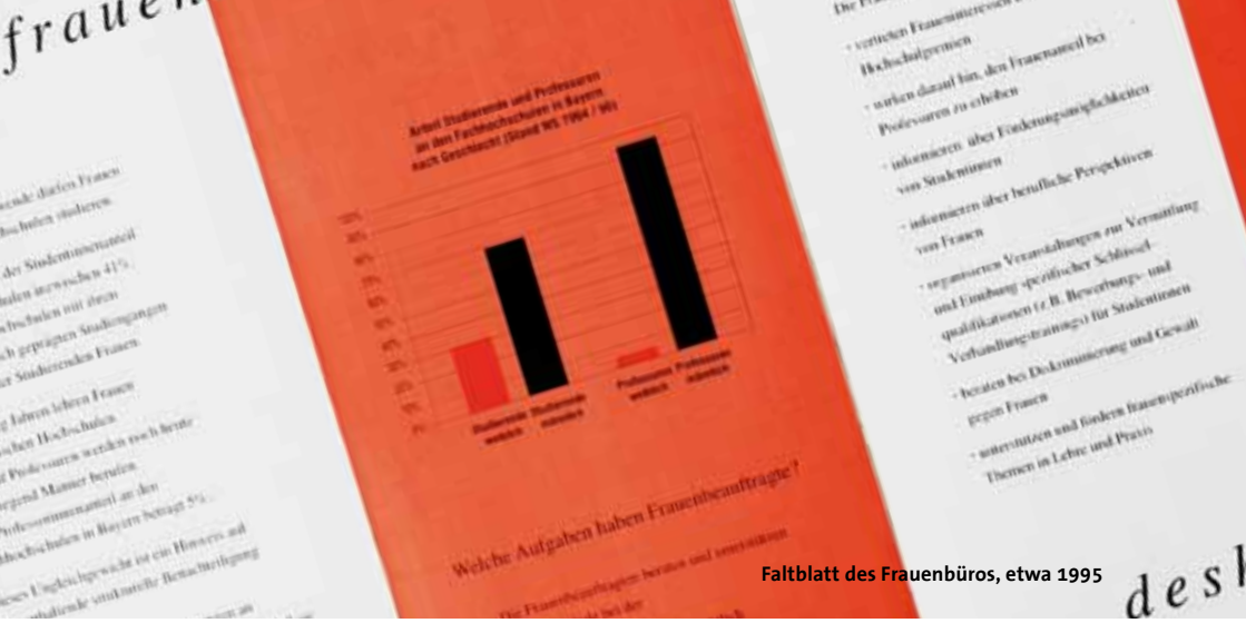
Faltblatt des Frauenbüros, etwa 1995

material und besuchte alle bayerischen Universitäten, z. T. mehrmals, um Veranstaltungen zum Thema »Weg zur Fachhochschulprofessur« abzuhalten.