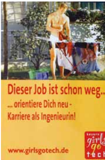
Plakat zum Projekt girls go tech