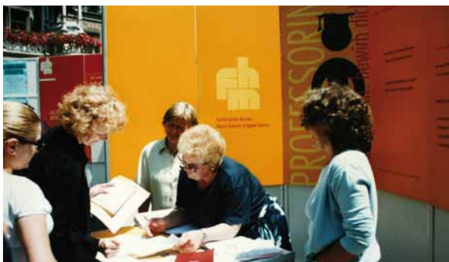
Infostand zum Weltfrauentag am Marienplatz

Spätestens mit der Neufassung des Bayerischen Hochschulgesetzes 1998 war allen hochschulpolitisch Interessierten klar, dass das Thema Gleichstellung von Frauen und Männern an den Hochschulen kein Modethema war, das bald wieder verschwinden würde (wie es die ersten Frauenbeauftragten gelegentlich zu hören bekamen), sondern seitens der Hochschulen längerfristig mehr Beachtung finden musste. Vor allem war inzwischen auch deutlich geworden, dass gelegentlich sogar Geld für die Fachbereiche im Zusammenhang mit dem Anliegen Geschlechtergleichheit in Aussicht stand, z. B. für Lehraufträge im Rahmen des Lehrauftrags-