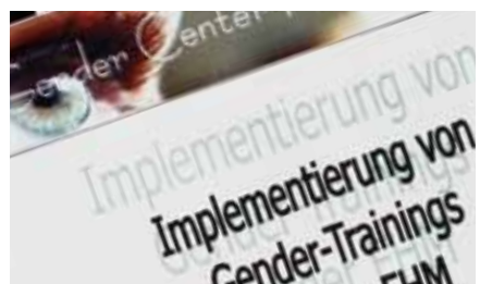
Faltblatt Gendertrainings (Ausschnitt)