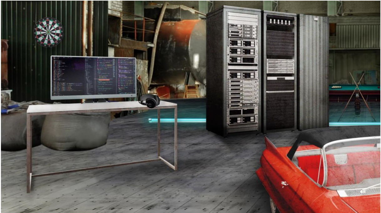
Abbildung 2: Originalaufnahme des Jaguar x Gorillaz Mixed-Reality Videospiel, abgerufen am 19.12.2023 um 18:00 Uhr unter: https://media.jaguar.com/news/2017/06/jaguar-land-rover-and-gorillaz-see-new-engineering-talent-alternate-reality

eingestellt wurde, was die langfristige Evaluierung und Analyse seiner Wirksamkeit und Reichweite erschwert.