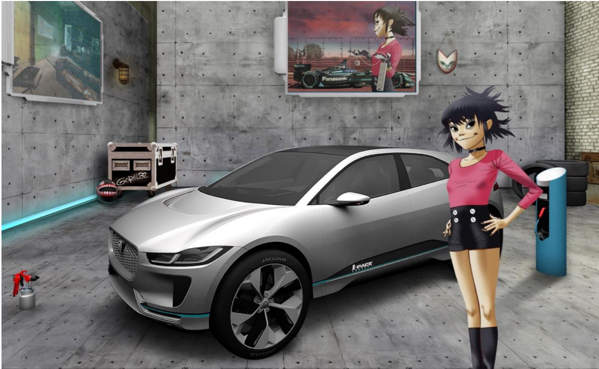
Abbildung 3 Originalaufnahme des Jaguar x Gorillaz Mixed-Reality Videospiel, abgerufen am 19.12.2023 um 18:00 Uhr unter: https://media.jaguar.com/news/2017/06/jaguar-land-rover-and-gorillaz-see-new-engineering-talent-alternate-reality