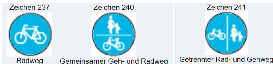
Abbildung 5: Zeichen für Radwege

Laut § 41 Anlage 2 VZ 237, 240, 241 StVO ist der Radweg ein Sonderweg für den Radverkehr. Abbildung 5 stellt die der Zeichen für den Radverkehr (Zeichen 237, 240 und 241) dar.