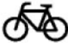
Abbildung 2: Sinnbild Radverkehr

Trotz der Tretunterstützung durch einen Motor sind Pedelecs nicht mit Kraftfahrzeugen gleichzustellen, da sie als „Motorfahrräder“ keine Typgenehmigungspflicht benötigen. 44 Vielmehr sind die Pedelecs rechtlich den Fahrrädern gleichgestellt. 45 Abbildung 2 stellt das Sinnbild für Fahrräder und Pedelecs auf Verkehrszeichen dar.