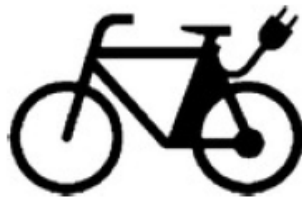
Abbildung 3: Sinnbild E-Bike

§ 39 Abs. 7 StVO definiert im Straßenverkehr für E-Bikes folgendes Sinnbild: