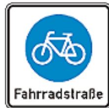
Abbildung 6: Zeichen Fahrradstraße

Dies bedeutet, dass S-Pedelecs eine Fahrradstraße nur befahren dürfen, wenn dies entsprechend gekennzeichnet ist.