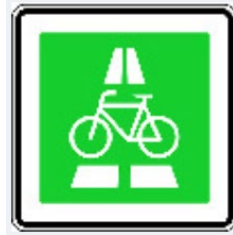
Abbildung 7: Zeichen für Radschnellwege

Vom Verkehrszeichen Radschnellweg gehen weder Gebote noch Verbote aus. 64 Dies bedeutet, dass grundsätzlich auch andere Fahrzeuge als Fahrräder auf einem Radschnellweg fahren dürfen. Ein Verbot von anderen Fahrzeugen ist vielmehr durch ein zusätzliches Verkehrsschild auszuweisen. Insofern hierfür die Zeichen 255 (Verbot für Kraftträder) oder 260 (Verbot für Kraftfahrzeuge) aufgestellt sind, schließt dies S-Pedelecs ein und diese dürfen folglich nicht auf dem Radschnellweg fahren.