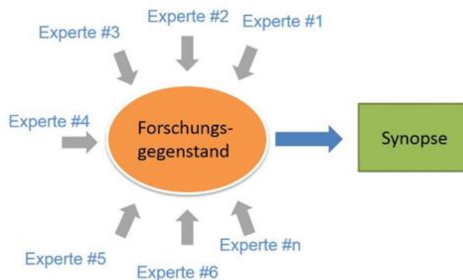
Abbildung 3: Experteninterviews bieten sich an, wenn eine zufällige Stichprobe von Personen zu einem Untersuchungsgegenstand kaum qualifiziert Auskunft geben kann.

Der Ansatz ist hier, per strukturierter Interviews mit ausgewählten Experten („Analogiequelle“) Hinweise auf die allgemeine Akzeptanz (eben auch unter Nicht-Experten – das „Analogieziel“) von IT-Systemen zu gewinnen.