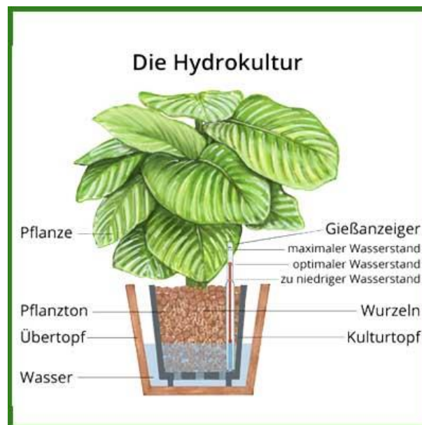
Grafik 2: Hydrokultur Pflanze, Urheber: unbekannt

Hydrokultur ist eine Methode der Aufzucht von höheren Pflanzen in wässrigen Nährlösungen anstelle von Erde. Der Vorteil gegenüber einer Kultivierung mit „normaler“ Erde liegt darin, dass die Nährstoffe der Pflanzen für den jeweiligen Zweck und die Pflanzen zusammengestellt werden können und die Versorgung leicht automatisiert werden kann (Spektrum 2022a). Die Hydrokultur ist ein exakt aufeinander abgestimmtes System, welches die herkömmliche Pflanzenhaltung mit Erde ersetzt. Als Ersatz kommt ein spezielles Kultursubstrat zum Einsatz, welches das Gießwasser langfristig speichert und nach und nach an die Pflanze abgibt. Dadurch wird das Gießen deutlich seltener notwendig und ist besser zu kontrollieren (Gartenlexikon 2022). Die folgende Grafik bildet ab, wie sich eine Hydrokultur zusammensetzt.