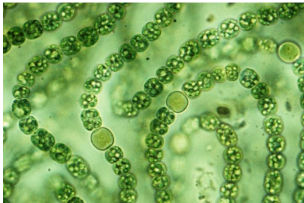
Grafik 3: Nahaufnahme der Cyanobakterien

Cyanobakterien , auch Blaualgen genannt, sind Mikroorganismen, die wie Bakterien einen prokaryotischen Zellaufbau besitzen, aber eine oxygene Photosynthese durchführen, in der Sauerstoff frei wird. Prokaryotisch ist eine Bezeichnung für Mikroorganismen, die morphologisch und cytologisch wenig differenziert sind. Hauptmerkmal ist das Fehlen eines echten, von einer Membran umschlossenen Zellkerns (Spektrum 2022c). Aufgrund ihres prokaryotischen Zellaufbaus und der DNA-Zusammensetzung müssen sie den Bakterien zugerechnet werden. Cyanobakterien haben große ökologische Bedeutung im globalen Kohlenstoffkreislauf und Stickstoffkreislauf und auch in der Evolution der Pflanzen. Sie sind weltweit in Süß-, Brack- und Salzwasser sowie überall im Boden Bodenorganismen verbreitet. Planktonische Cyanobakterien haben einen sehr hohen Anteil an der photosynthetischen Kohlendioxidfixierung, und als Primärproduzenten stehen sie oft an der Basis der Nahrungskette in marinen Habitaten. Sie haben auch erheblichen Anteil an der Primärproduktion in Binnengewässern. Es wird geschätzt, dass 20 bis 30% der photosynthetischen Kohlendioxidfixierung durch Cyanobakterien erfolgt. Es gibt auch fakultativ chemotrophe Formen, die im Dunkeln z.B. mit Glucose als Energie- und Kohlenstoffquelle wachsen. Glucose wird dabei im oxidativen Pentosephosphatzyklus vollständig zu \text{CO}_2 oxidiert (Spektrum 2022b). Die folgende Grafik zeigt Cyanobakterien in der Nahaufnahme.