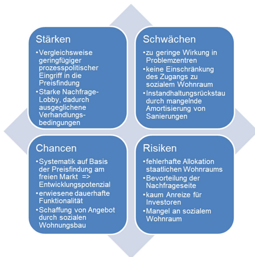
Abbildung 3 : SWOT-Analyse des schwedischen Kollektivverhandlungssystems

Die nachhaltige Wohnungsknappheit wird von den marktorientierten Parteien Schwedens kritisiert und ein freier Markt und die Abschaffung der Kollektivverhandlungen gefordert. Weiterhin die Einführung von Sozialwohnungen bzw. die Förderung eines sozialen Wohnungsbaus, der aber in Schweden derzeit faktisch nicht existiert. Dies ist folglich mit hohen Kosten für den Staat und einer großen Umstrukturierung verbunden. 68 Um dem Investitions- und Neubauhemmnis für Bauherren entgegenzuwirken wurden höhere Mieten bei Neubauten zugelassen und Mieter verpflichtet, bei Erstbezug diese anzuerkennen. In einem solchen Fall darf die Wohnung für 10 Jahre nicht als Vergleichsobjekt zur Mietbestimmung herangezogen werden und wird so in diesem Zusammenhang nicht in den Durchschnittswert der Marktmiete eingerechnet. 69